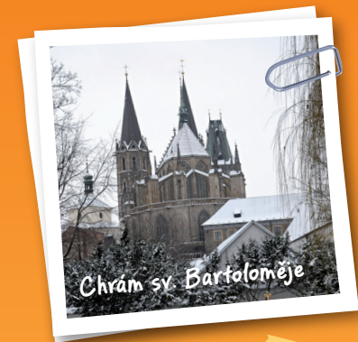
Chrám sv. Bartoloměje