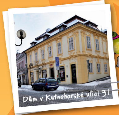
Dům v Kutnohorské ulici 31