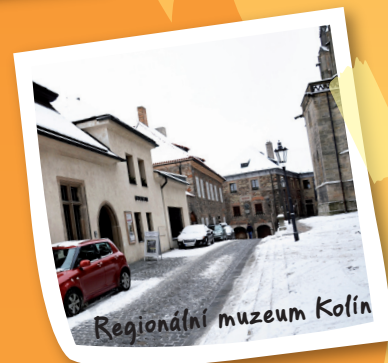
Regionální muzeum Kolín