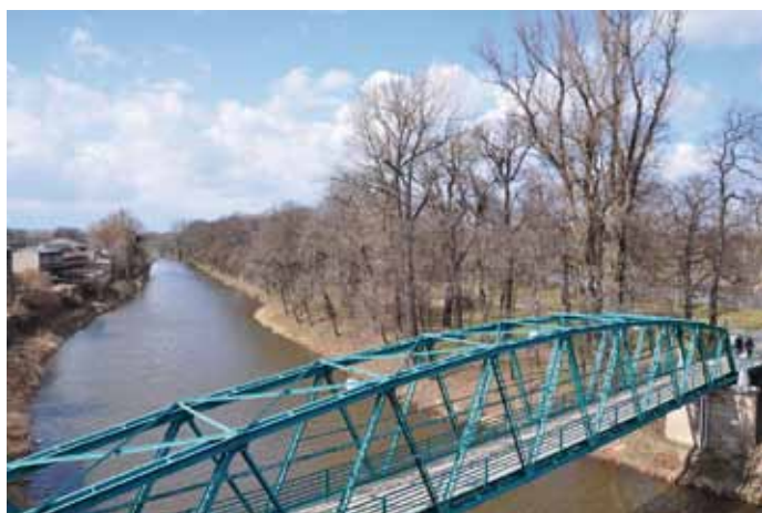
■ Pohled na Dolní Nekojnou nebo také Dolní ostrov, dnešní Kmočův, kde měli kolínští střelci svou druhou střelnici.

Ostrostřelecký sbor byl nakonec roku 1859 úředně rozpuštěn a jeho místo zaujala střelecká společnost, která převzala majetek i střeleckou tradici, v níž hodlala nadále pokračovat. Tomuto spolku se ale na Hořejším ostrově už nevedlo tak dobře jako jeho předchůdci. Zálabští občané si činili nárok na vlastnictví ostrova a soudní spor, který se střeleckou společností vedli, nakonec v roce 1869 vyhráli. Střelci museli Nekojnou opustit a přestěhovat se na Dolejší (dnešní Kmočův) ostrov. Zde byla střelnice umístěná na dolní špici, kde stála rozměrná prosklená dřevěná budova na zděných základech. Uvnitř bylo umístěno vybavení ze staré střelnice, tedy veranda se střílnami, za nimi se táhla úzká dráha, na jejímž konci stál terč, který již ale nebyl