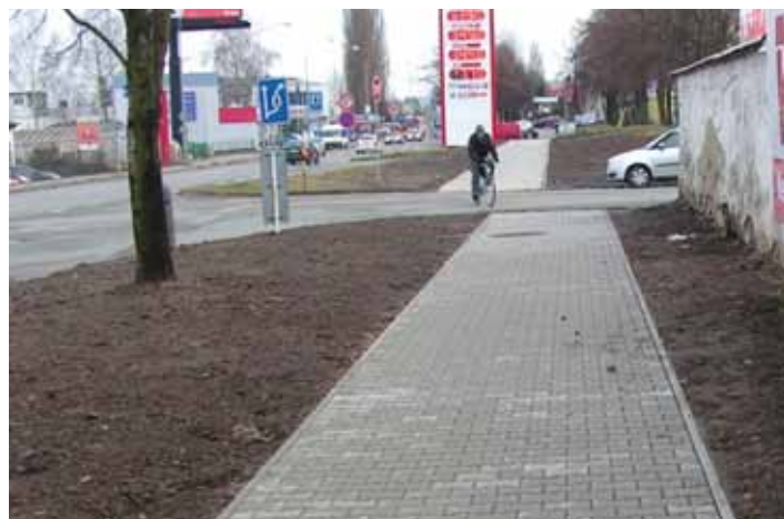
■ Ulice Havlíčkova.