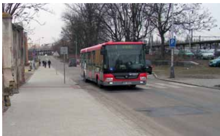
■ Ulice Rorejcova.