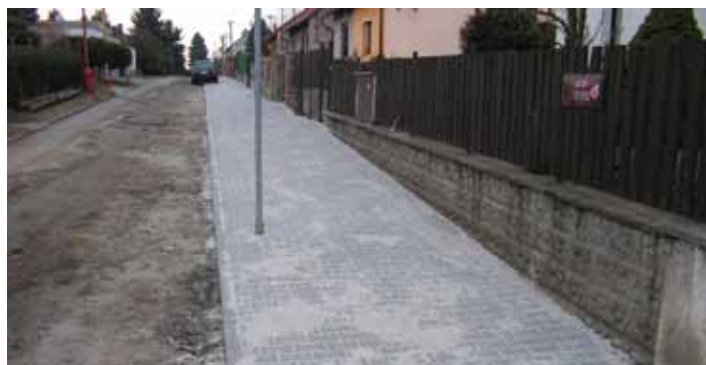
■ Ulice Pírkova.