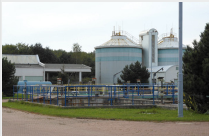
■ Kolínská čistírna odpadních vod.

současné osazenstvo radnice čekalo na přidělení dotace, které by v daném případě bylo jistě úspěchem vedení minulého. Nicméně se tak nestalo. Žádost byla městu Kolínu vrácena s tím, že její náležitosti neodpovídají představám a pokynům Evropské komise. Konkrétně se jednalo o tzv. „oddělitelnost“ vodohospodářské infrastruktury (laicky řečeno – byl napaden postup, kdy předmětem soutěže byla pouze rekonstrukce čističky bez přidružené kanalizace). Marná byla argumentace, že daný postup vycházel z