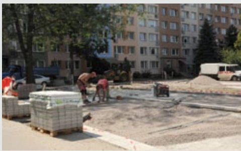
Výstavba parkoviště v ul. Rim. Soboty.

* Parkování na sídlišti je dlouhodobým problémem. Nedostatek parkovacích míst určitě zmírní právě budované parkoviště v ul. Rimavské Soboty. Můžete tuto akci přiblížit?