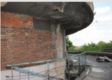
Detail poškozené vodárenské věže.

* V letošním roce se podařilo získat dotaci na opravu kolínské dominanty - vodárenské věže. Záchranné práce začaly v červenci. Bude po letošních opravách vodárna přístupná?