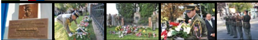
IN MEMORIAM GENERÁLMAJOR Josef Mašín

Svoboda není statek udílený zadarmo. Za svobodu se platí krví. Všichni, kdo mohou svobody užívat, by měli mít vždy na paměti ty, kteří za ní zaplatili nebo byli připraveni zaplatit.