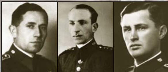
IN MEMORIAM GENERÁLMAJOR Josef Balabán

Od 16,00 hodin u památníku podplukovníka Josefa Mašína, generálmajora in memoriam v Lošanech