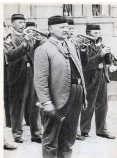
21. František Kmocho v čele s dechovými kapelami v roce 1893.

27. května členové KPFK vyjedou do Prahy, do Valdštejnské zahrady, na jeden z koncertů Pražského jara 2012. Je poprvé v historii Pražského jara věnován právě Františku Kmochovi, což je velká pocta. Hudba Hradní stráže a Policie ČR budou hrát Kmochovy skladby v jeho původních úpravách, půjde tedy o unikátní zážitek. Koncert začíná v 15 hodin a vstup do Valdštejnské zahrady je volný. Zr