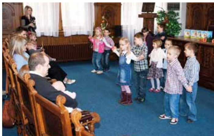
■ V obřadní síni radnice se dne 7. 4. 2012 konalo vítání občánků. Ceremoniál tentokrát zpestřilo kulturní vystoupení dětí z MŠ Bachmačská.

Provedenou rezervací je možné zaplatit on-line pomocí platební karty (do jedné hodiny od rezervace) nebo v pokladně či předprodeji Kina 99 do tří dnů před vybraným představením. V případě on-line platby je na registrovaný e-mail obratem doručena e-vstupenka, kterou si objednatel vytiskne a přinese na vybrané představení. šk