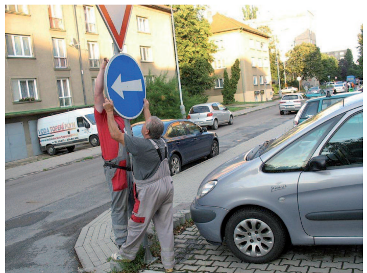
■ Instalace dopravního značení v ul. Míru a okolí

Bezpečný návrat z cest Vám přeje Tomáš Růžička, 1. místostarosta města Kolína