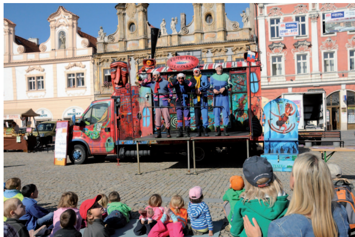
■ Ve dnech 14. a 15. září hostil Kolín již šestnáctý ročník festivalu nonverbálního a pouličního divadla Kašparův Kolínský mimoriál. Zatímco na Karlově náměstí byly k vidění zejména pouliční prvky, velký sál "kulturáku" se proměnil v divadelní scénu, na níž se aktéři svlékali, tančili nebo předváděli obdivudodné sportovní výkony.