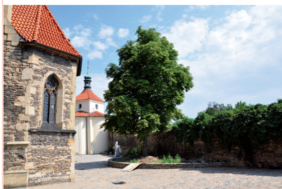
■ V těchto měsících proběhla rekonstrukce prostoru za kostelem, kde travnaté plochy nahradila dlažba. V budoucnu by i tato místa měla být zpřístupněna veřejnosti.