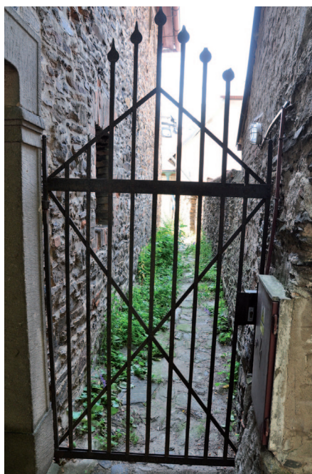
■ Dnes je vstup do uličky uzavřen mříží.