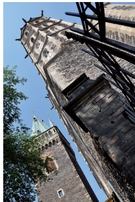
■ Pohled na kostelní věž a zvonici od vstupu do rekonstruovaného prostoru za kostelem sv. Bartoloměje.