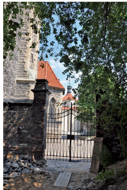
■ Pohled od školy na dnes prozatím nepřístupný uzavřený prostor za kostelem sv. Bartoloměje.