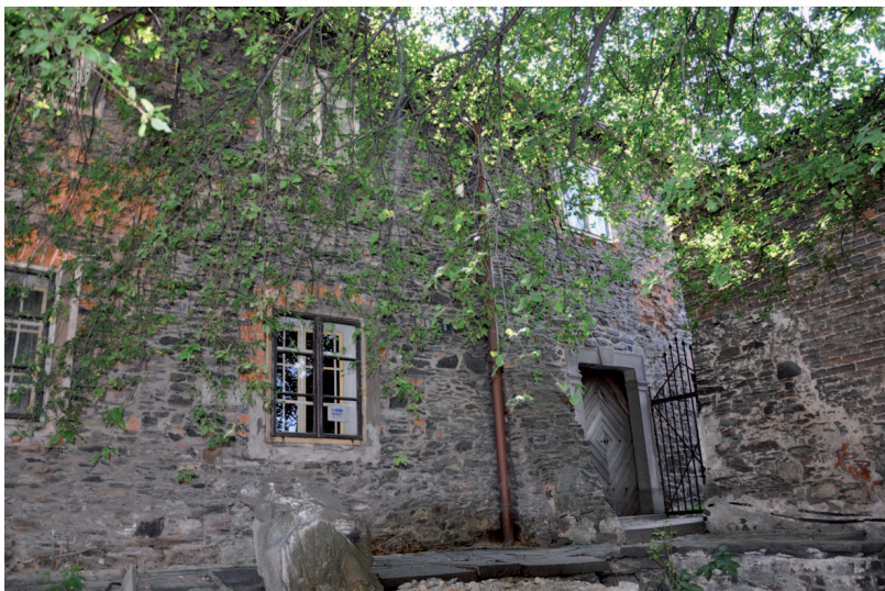
■ Kolínská škola a vpravo zamřížovaný vstup do uličky spojující původně chrámový areál s Kouřimskou ulicí.