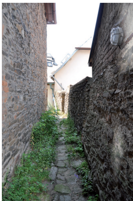
■ Pohled do uličky vedoucí původně do Kouřimské ulice.