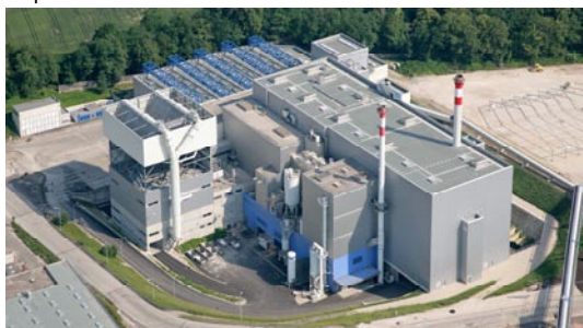
Spalovna komunálního odpadu WAV, Wels

AVE CZ odpadové hospodářství s.r.o. vznikla v červenci 2004 převzetím všech aktivit společnosti RWE Umwelt, která je na českém trhu aktivní již od roku 1993. Skupina AVE patří k největším podnikům v oblasti odpadového hospodářství ve střední Evropě. Nabízí likvidaci a recyklaci odpadů obcím, živnostníkům, průmyslovým podnikům i domácnostem. Skupina AVE se dlouhodobě zaměřuje na strategické investice do technologií zpracování odpadů. Tyto investice jí umožňují nejenom udržovat vynikající postavení na trhu, ale především podnikat s citlivým přístupem k životnímu prostředí. Největším a nejmodernějším zařízením na odstranění odpadu, které AVE provozuje, je spalovna komunálního odpadu v rakouském Welsu – WAV. Tato spalovna má kapacitu 300 tis. t odpadů za rok, tepelný výkon 108 MW a vyrobenou elektrickou energii dokáže zásobovat až 60 tis. domácností. Mezi další významná zařízení patří například fluidní spalovna v Lenzingu a recyklační linka na elektrotechnický odpad a chladicí zařízení v Timelkamu.