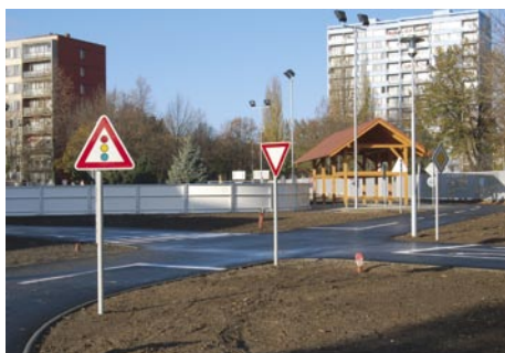
Dětské dopravní hřiště v Kolíně je v zimním období využíváno jako ledová plocha.

Počet stálých zaměstnanců se pohybuje kolem 120 a v době hlavní sezony tj. v letních měsících stoupá až na 150 pracovníků.