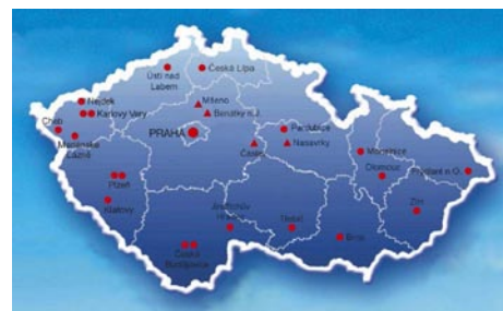
AVE CZ působí na celém území ČR

Samostatné oddělení tvoří sanace starých ekologických zátěží, které se skládá ze skupiny specialistů – geologů a hydrogeologů, kteří řeší převážně zakázky týkající se sanačních a nápravných akcí, hrazené z prostředků Ministerstva financí. Oddělení sanací je činné na celém území ČR i v zahraničí. Mezi největší projekty patří sanace lagun dehtových kalů „Růžodol“ na území Chempetrol a.s., Litvínov.