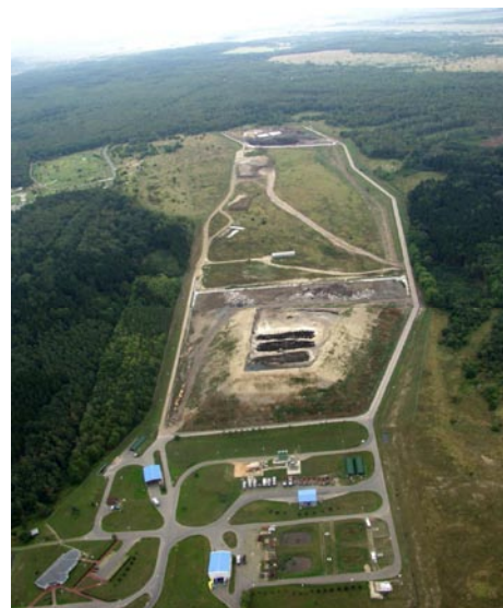
Skládka Benátky nad Jizerou

Společnost je držitelem certifikátů: Systém jakosti dle ČSN EN ISO 9001:2001, systém environmentálního managementu dle ČSN EN ISO 14001:2005 a systém řízení lidských zdrojů dle OHSAS 18001:1999 (Occupational Health and Safety Series). AVE CZ je také certifikována jako "Odborný podnik pro nakládání s odpady".