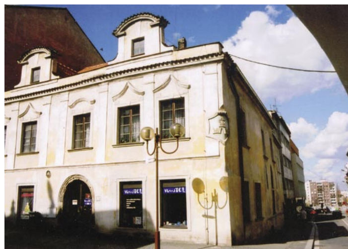
Ani obyvatelé domu U tří korun nedaleko Horské brány nebyli ušetřeni výtržností zámecké čeládky. Text a foto Martin Drahoval

Jednoho večera si to ale Kolínští nenechali líbit a zámecké čeládce se postavili. Jenže opilci vytrasili rapíry a počala téct krev. Vzápětí začali z domů vybíhat další sousedé, většina jen v noční košili, ale zato se zbrání v ruce, a došlo k velké bitce, v níž byli zámečtí pořádně ztlučeni a prchli zpět s mnoha zraněními.