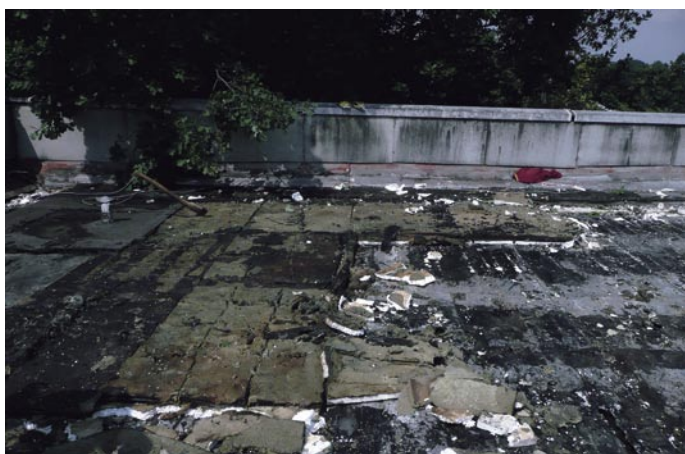
Největší problém: tuny vodou nasáklé staré izolace.