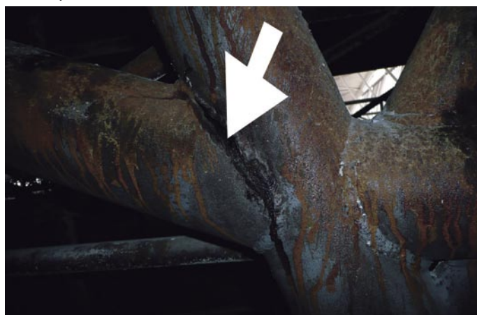
Prasklina do které se nechala vsunout lidská ruka.