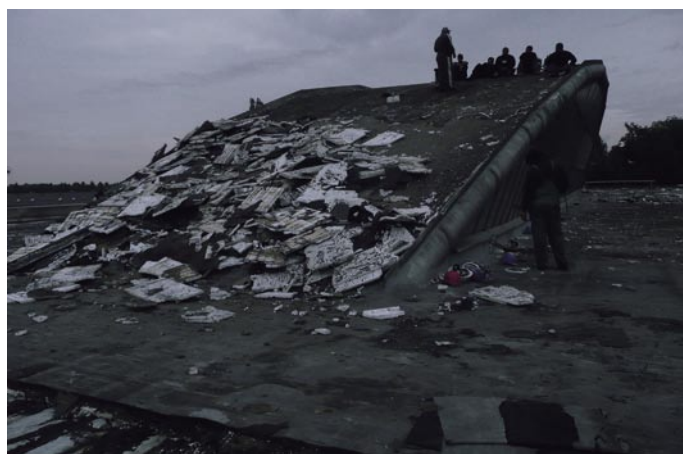
Nejkritičtější místem střešního pláště se proti předpokladům je střecha prosvětlovacího oblouku.