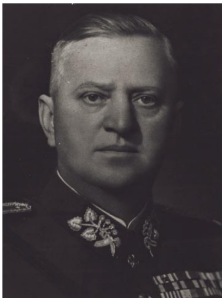
Brigádní generál Antonín Pavlík, foto z mládeže 1917

Dne 8. září 2008 v odpoledních hodinách zazní při pietních aktech u pamětní desky