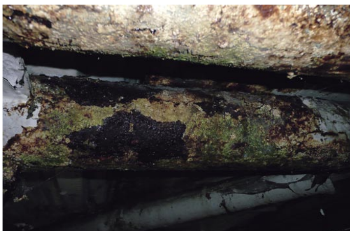
Pohled na části nosné konstrukce pod střechou. Potřebují komentář?