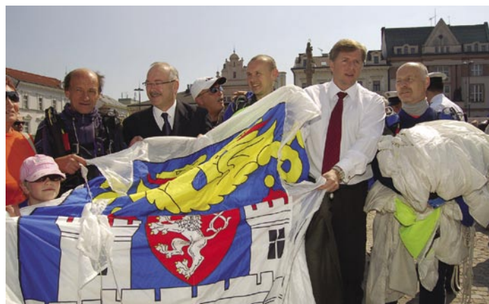
■ Aeroklub Kolín připravil divákům atraktivní podívanou v podobě seskoku parašutistů s vlajkami na Karlovo náměstí.

nechyběla Krajská hygienická stanice, která zájemcům změřila cholesterol, cukr v krvi nebo tlak. Jedním ze zlatých hřebů dopoledne na Karlově náměstí bylo předání více jak dvaceti nových automobilů Peugeot 106 v barvách HZS, které budou středočeš-