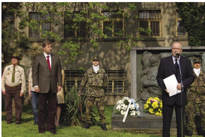
■ Pietní akt u pomníku obětem válek v Sokolské ulici.