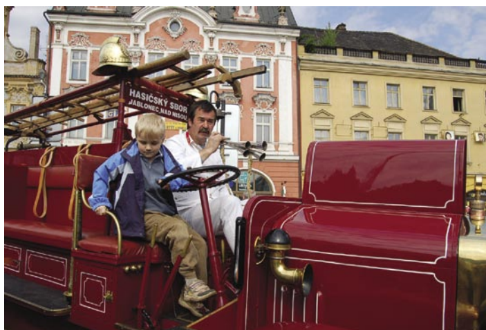
■ Děti neváhaly si na vlastní kůži vyzkoušet jak se dřív jezdilo hasičům. Historická technika se na Dni záchránářů těší velké oblibě.

torii a vyznávali ho již maltézští rytíři. Po oficiálním zahájení následoval pietní akt u pomníku obětem válek. „Tradičně se scházíme na tomto místě, abychom uctili památku všech známých i neznámých bojovníků a obětí 2. světové války, která skončila právě před 63