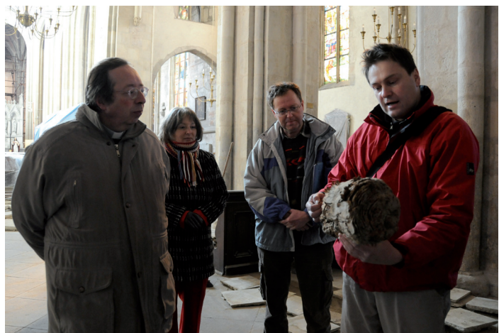
■ Odkrytí podlahy přineslo zajímavé nálezy. Jedním z nich byl kus dřeva, jehož stáří historici předběžně odhadli jako "dobu Petra Parléře". Detailní analýza by mohla upřesnit dobu výstavby základů chrámu. Na spodní fotografii jsou fragmenty kostí, nalezené v zásypu po odkrytí podlah v kostele.