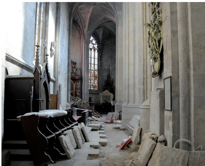
■ Během rekonstrukce sv. Bartoloměje prošlo obnovou trojlodí kostela. Ošetřeny byly i boční lodě. Podařilo se také renovovat polovinu lavic.