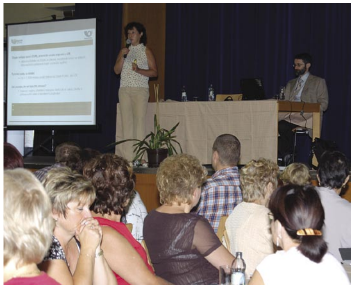
■ 8. září uspořádala Okresní hospodářská komora spolu s Městským úřadem Kolín seminář k problematice datových schránek. Seminář určený starostům pověřených obcí, příspěvkovým organizacím, podnikatelům i veřejnosti si do MSD přišlo poslechnout více než 150 lidí.