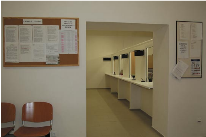
■ text šk/statistika odboru dopravy, zpracovaná J. Jeřábkem.