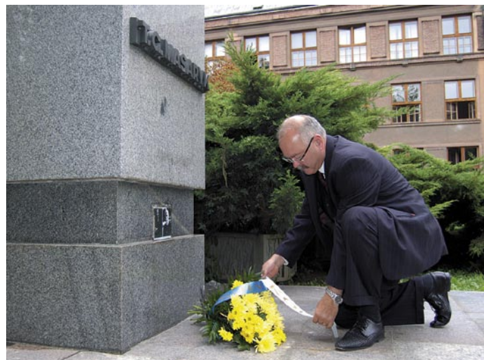
■ „Mravnost je poměr člověka k člověku.“. 14. září uplynulo 72 let od úmrtí prvního československého prezidenta T. G. Masaryka.