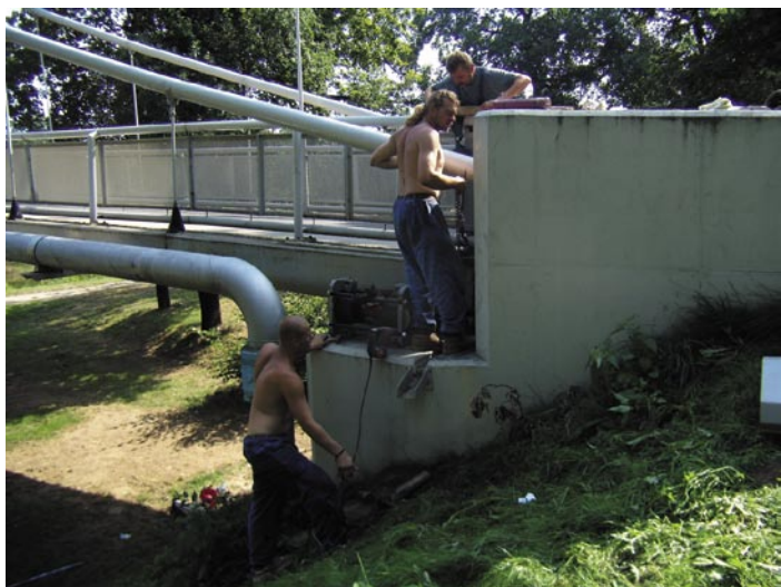
■ Na přelomu srpna a září instalovala firma SDS Exmost do konstrukce lávky přes Labe pro pěší a cyklisty nové dilatační prvky. Dva tlumicí prvky byly umístěny po obou stranách mezi konstrukci lávky a opěrné zídky. Důvodem opravy byla vada původních tlumicích prvků, které nevyrovnávaly osový pohyb při tepelné dilataci lávky. Váha jednoho tlumiče je cca 400 kg.