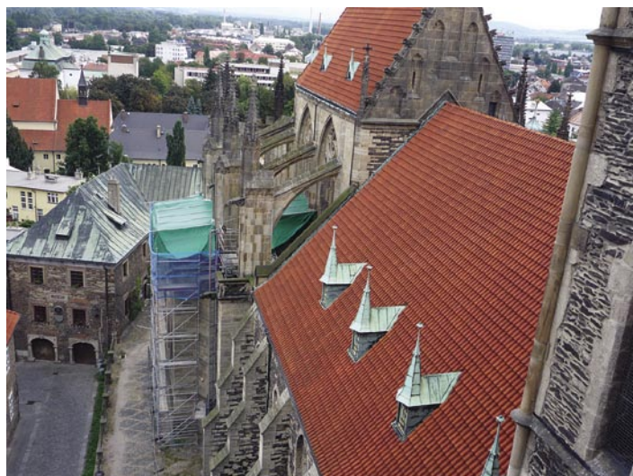
■ Záříjové Dny evropského dědictví znovu nabídky to nejatraktivnější z Kolína. Velký zájem návštěvníků zaznamenala zvonice chrámu sv. Bartoloměje, židovský hřbitov i synagoga. Hitem se staly autobusové exkurze za památkami Kolínska a krajinou bitvy u Kolína, které byly zcela vyprodány.