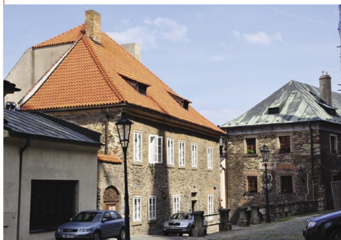
■ Požár zachvátil zvonici i obě věže chrámu a také budovu děkanství. Text a foto: Martin Drahovzal

Chodil prý mládenec po zahradě s flintou, chodí a kouká, a najednou vidí zlatého ptáčka. Zamíří, ale ptáček frnk, ulítne a sedne na strom dál. Zase zamíří, ptáček zas ulítne včas. A tak ho ten zlatý ptáček vede po zahradě dál a dál, až ku špejcharu, tam sedne na doškovou střechu a sedí. Mládenec si myslí: „Teď mi neujdeš,“ míří dlouho, opatrně a potom: bác! Ptáček pryč, ale špejchar hoří. A protože byla střecha z došků a bylo to v létě, byla najednou celá v plamenech. A tenkrát vyhořel Kolín z veliké části pro toho zlatého ptáčka.