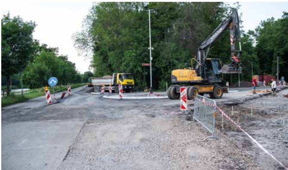
Nově vytvořený kruhový objezd v Brankovické ulici u atletického stadionu zjednoduší dopravu ke sportovištím, bude sloužit i jako točna autobusů

V červenci loňského roku byla zahájena investiční akce, během které je postupně revitalizován prostor před budovou a v areálu kolínského gymnázia. V loňském roce již byly vybudovány trasy nové dešťové kanalizace, veřejné osvětlení, slavnostní nasvícení uliční fasády a nové chodníky před budovou. V le-