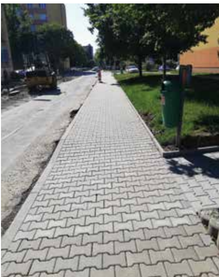
Ulice Na Magistrále na kolínském sídlišti. Nový kanalizační řad je již v zemi, nyní probíhá pokládka chodníků a příprava na asfaltování vozovky. Hotovo a zprůježděno by mělo být do konce června.

tošním roce se pokračuje v rozšíření dešťové kanalizace, aby byl zajištěn odvod srážkové vody i z vnitřního prostoru areálu. Proběhla revitalizace zelených ploch, byly založeny květinové záhony a stromová alej. Stávající chodníky budou nahrazeny novými s žulovými kostkami. Opraví se volejbalové i beachvolejbalové hřiště. Projekt počítá i s opravou podstavce sochy T. G. Masaryka. Veškeré práce budou probíhat tak, aby nedošlo k poškození památných stromů. Akce bude intenzivně pokračovat přes prázdniny a hotovo by mělo být do konce září. Jsme přesvědčeni, že výsledek nové podoby prostoru kolem jedné z dominant města bude velice zdařilý.