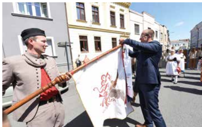
150 let Městské hudby Františka Kmocha, koncert MHFK a průvod od budovy Sokola na Karlovo náměstí