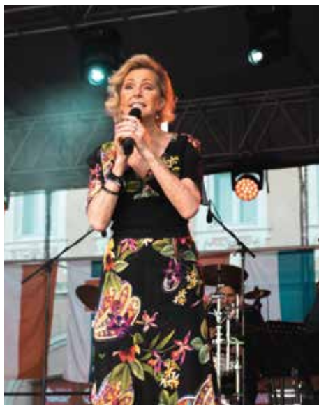
Helena Vondráčková patřila mezi hlavní hvězdy 57. ročníku festivalu Kmochův Kolín

Do večerního programu jsme stejně jako v minulých letech zařadili dva koncerty, které jsou právě zmíněným propojením jednotlivých žánrů. Páteční vystoupení skupiny Tata Bojs i sobotní koncert ikony české pop music Heleny Vondráčkové určité festivalu na kvalitě neubraly a svědčí o tom náměstí zcela zaplněné diváky při obou koncertech.