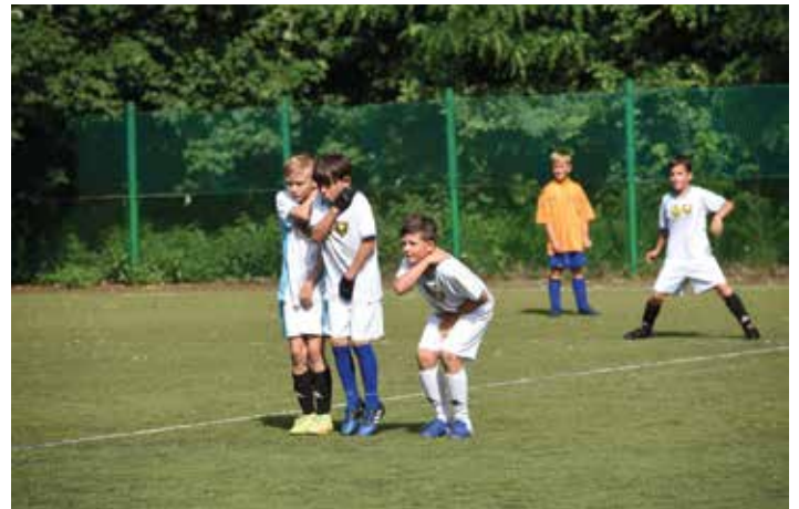
Malí fotbalisté v postojích jako profi hráči