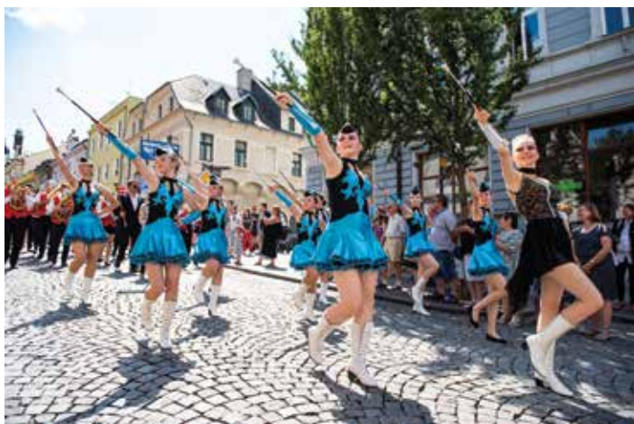
Mažoretky patří během celého festivalu k nejatraktivnější podívané