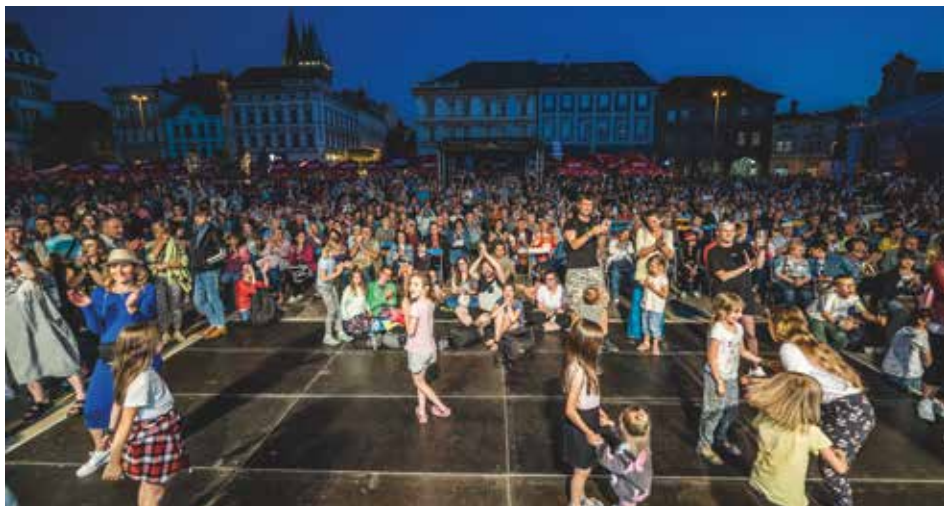
Večerní atmosféra na náměstí

Sobota byla dnem, kdy se v domově seniorů tak jako v minulých letech představil kolínský dechový orchestr Harmonie 1872. Atmosféra v domově byla úžasná až dojemná, při písničkách se často objevila nejedna slzička.