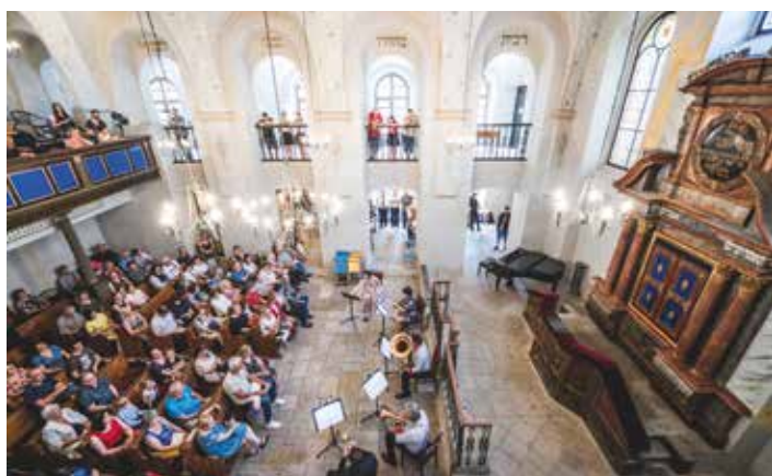
Synagoga nabídla posluchačům komornější scénu i vystoupení