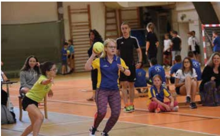
Házená patřila mezi sporty, které si řada dětí s nadšením zkusila poprvé