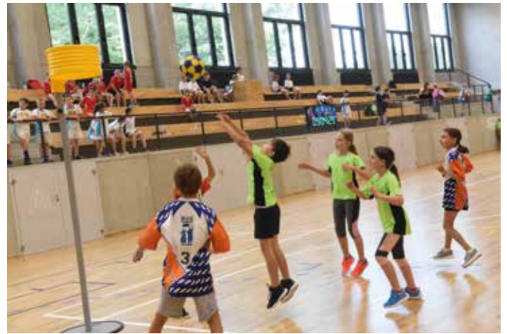
Korfbalový turnaj se odehrál v nové sportovní hale Borky