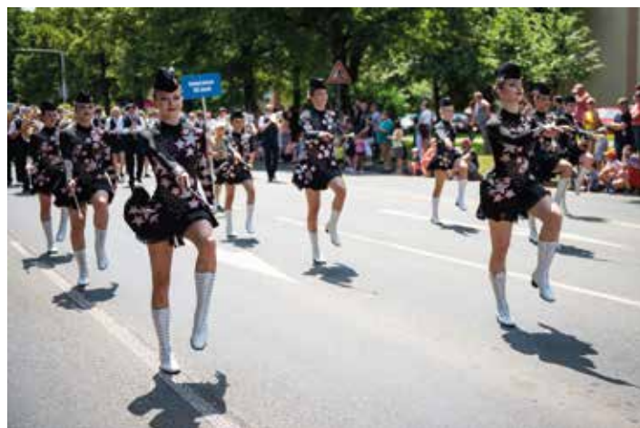
Celá trasa průvodu byla lemována spoustou diváků všech generací