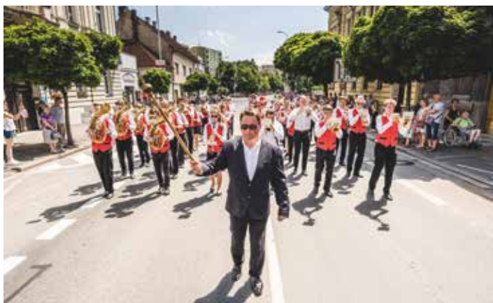
Dechový orchestr ZUŠ Františka Kmocha Kolín