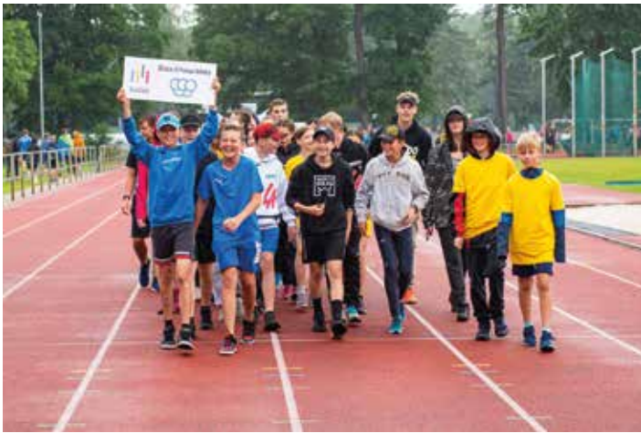
Slavnostní zahájení kolínských sportovních dní na atletickém stadionu