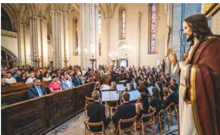
Nocturno v chrámu sv. Bartoloměje odehrál orchestr Harmoie Šternberk