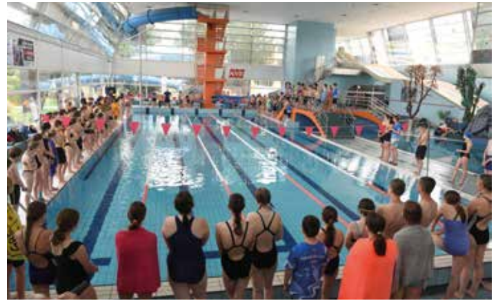
Závodů v plavání se konaly ve Vodním světě Kolín