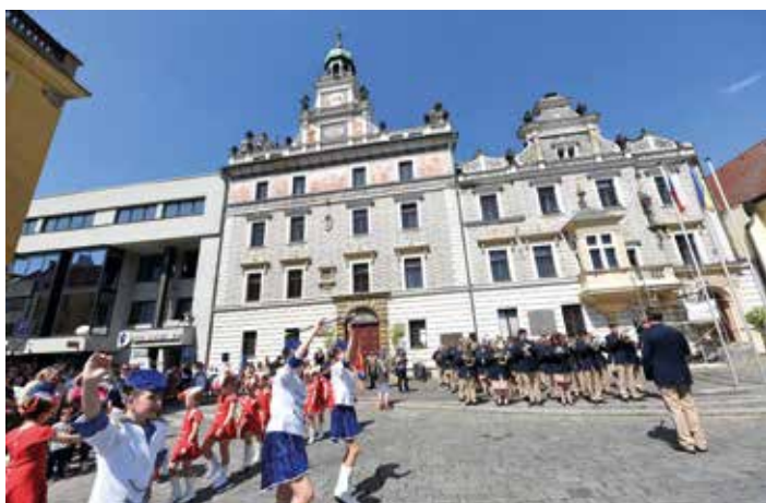
150 let Městské hudby Františka Kmocha, vystoupení na Karlově náměstí