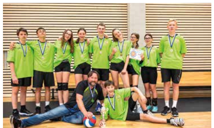
Úspěšní volejbalisté ze ZŠ Kmochova