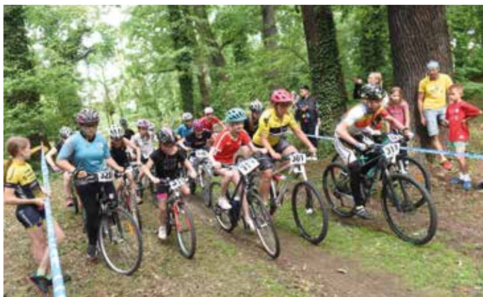
Před startem cyklistického závodu v kategorii dívek 6. – 7. tříd