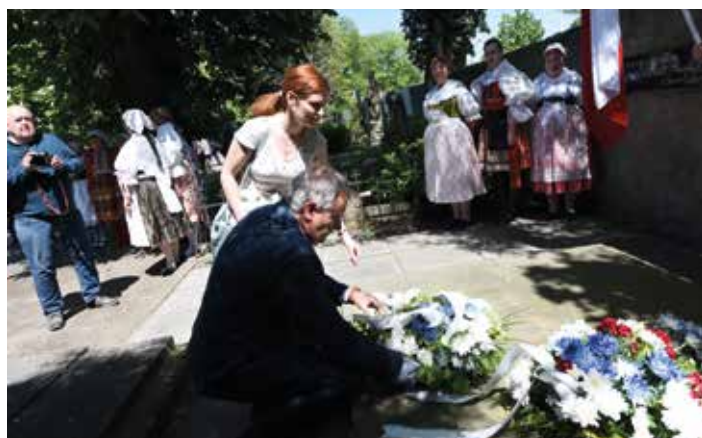
150 let Městské hudby Františka Kmocha, pietní akt na kolínském hřbitově, vpravo slavnostní koncert v Městském divadle v Kolíně