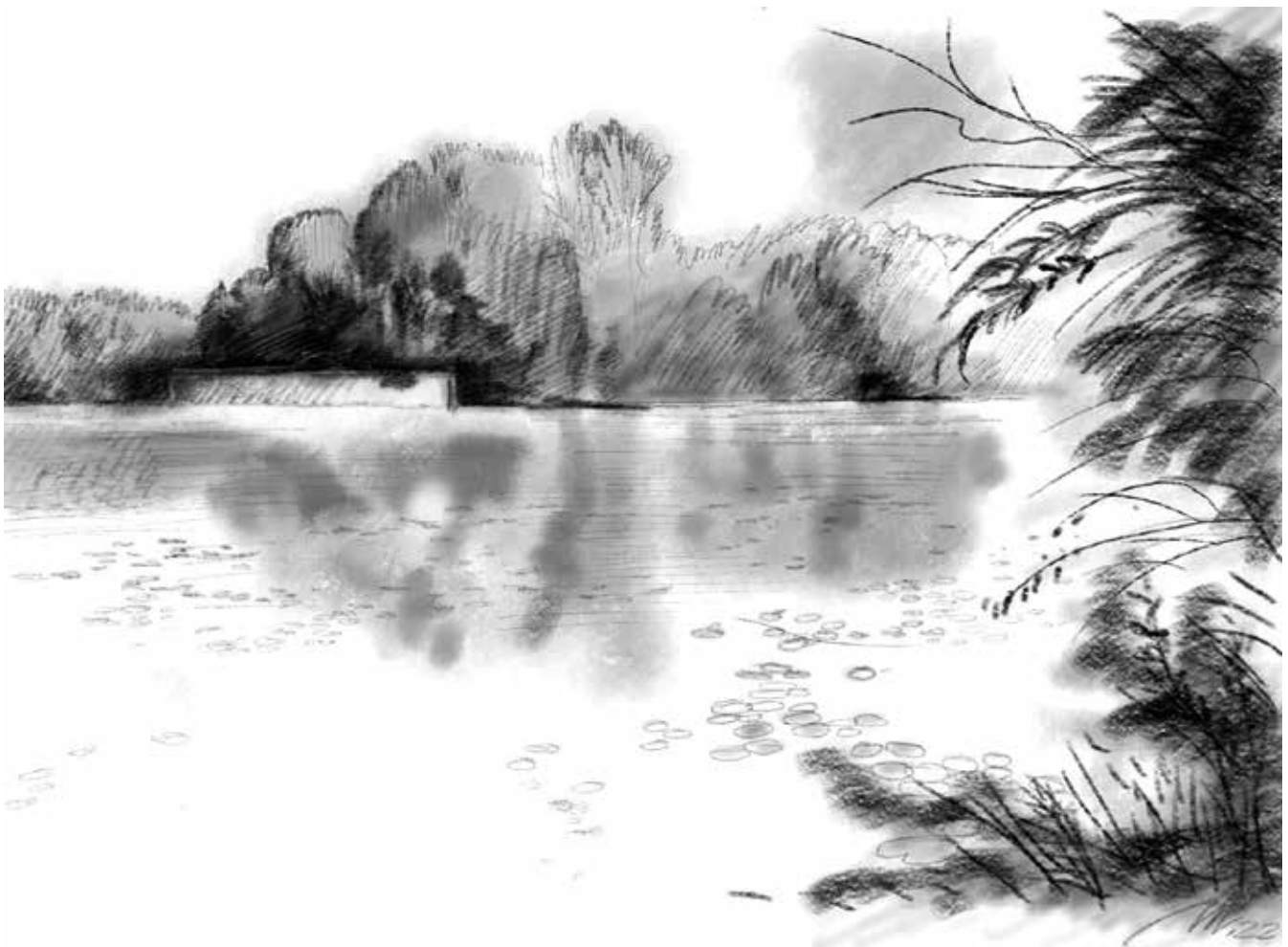
Kresba: David Mateásko

Pozůstatkem a jediným svědkem myšlenky „megapřístavu“ je dodnes zeď v slepém ramenu řeky Labe. Tento projev přesného lineárního plánování člověka je v kontrastu k divoké a spontánní okolní přírodě slepého ramene řeky vlastně již jakýmsi „landartovým“ prvkem.