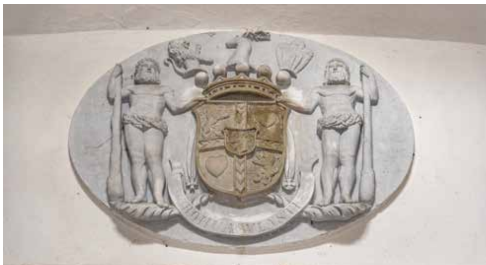
Rodové heslo zní: „Bohu a vlasti.“ Takto je zobrazeno v rodinné hrobce v Červených Pečkách.