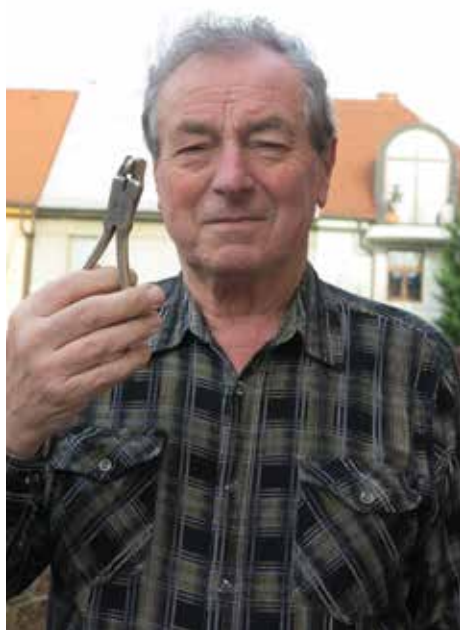
Poslední kolínský klavírník ukazuje vymačkávací kleště na klávesy. Nové by dnes vyšly tak na tři tisíce...