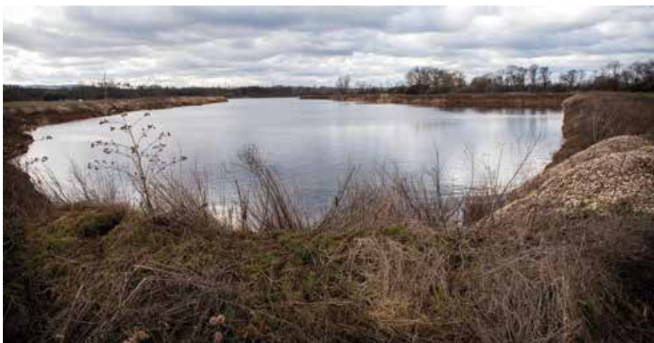
O výslednou podobu rekultivace Sandberku se ještě bude bojovat

Jak se čtenáři tohoto čísla Zpravodaje mohli dočíst v úvodníku starosty, firma KAMENOLOMY přepracovala záměr o zavezení břehů Sandberku. Je to vítězství dosažené díky odborně podloženému nesouhlasnému