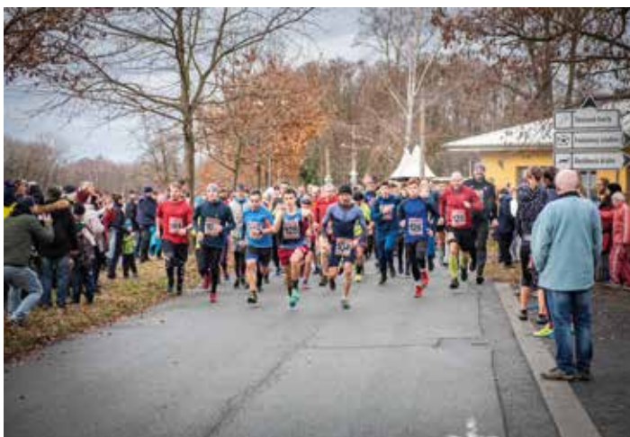
Silvestrovský závod běhají ženy, muži, děti bez rozdílu věku