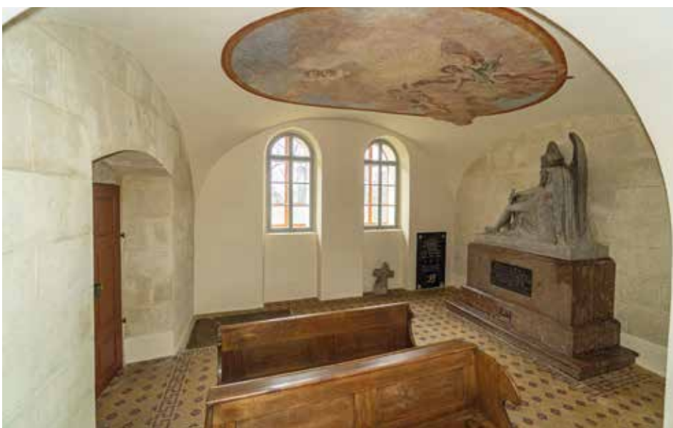
Oratoř Hrubých z Gelenj s hrobkou příslušníků prvních generací majitelů červenopečeckého panství z jejich rodu v kostele Narození Panny Marie v Červených Pečkách