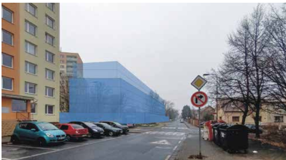
Orientační zakres hmoty nového objektu

V ulici Jateční má soukromý investor zájem postavit na volném pozemku u zastávky autobusu „U Jána“ nový polyfunkční dům nemalého rozsahu „Rezidence U Jána“. Územní rozhodnutí na tento záměr bylo vydáno již v roce 2008 a od té doby bylo prodloužováno. Během této doby však došlo v rámci změn územního plánu k výrazně přísnějším požadavkům na maximální zastavěnost, počet odstavných a parkovacích stání atd. Vzhledem k tomu, že se jedná o významný stavební záměr v této lokalitě, který výrazně ovlivní své okolí, město požadovalo na investorovi uspořádat alespoň veřejné představení a potřebnou mediaci. Tento požadavek byl odmítnut s poukázáním na přesvědčení, že stavební záměr byl dostatečně prezentován již v minulosti v rámci řízení o vydání územního rozhodnutí, kdy se k němu mohla veřejnost v dostatečné míře vyjádřit. S ohledem na dlouhou dobu od vydání ÚR se město s tímto závěrem neztotožňuje nejen vzhledem k jeho kapacitám a velikosti, která není v souladu se stávajícím územním plánem. Snažili jsme se diskusí, náměty a konzultacemi přimět investora k revizi a úpravám záměru – bohužel bezvýsledně. Prozatím