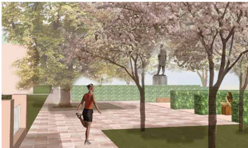
Vizualizace prostoru před gymnáziem

(instalace nabíjecí stanice pro elektrokola a nových stojanů na kola). V roce 2022 se informační centrum znovu otevře veřejnosti.