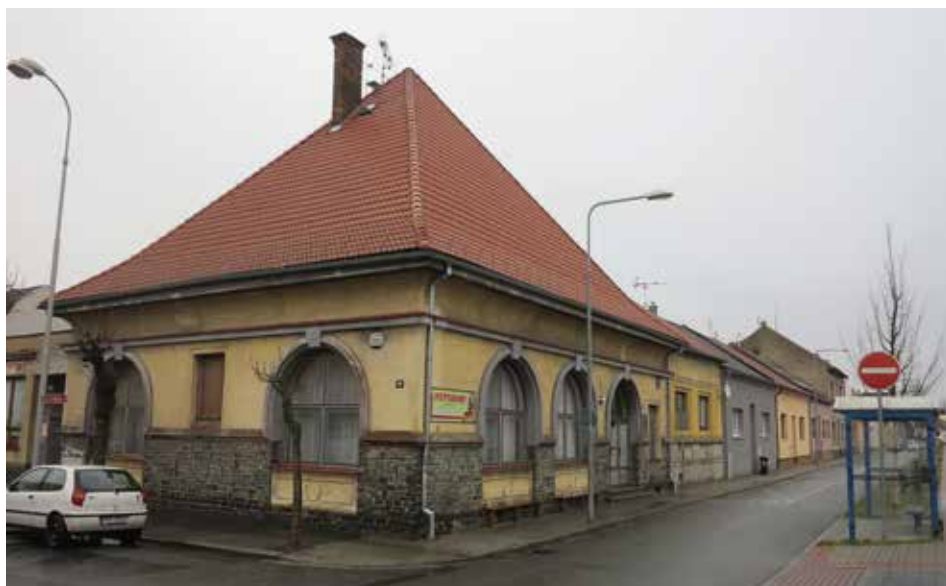
Bývalá restaurace Dymokurská. Na lepší časy upomínají už jen dvě lavičky při chodníku.