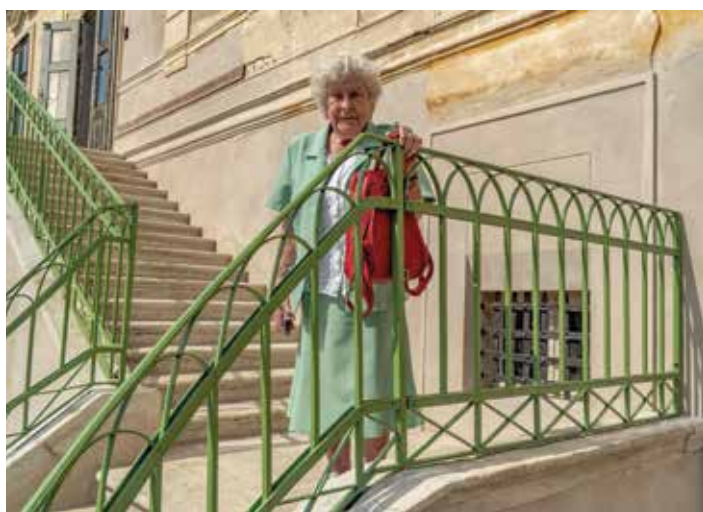
Kolikrát běžela v dětství po tomto schodišti ze zámku do parku v Červených Pečkách!