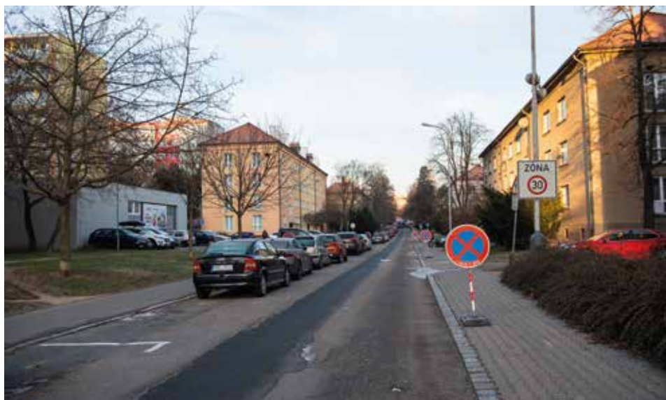
Aktuální stav ulice Na Magistrále před začátkem rekonstrukce