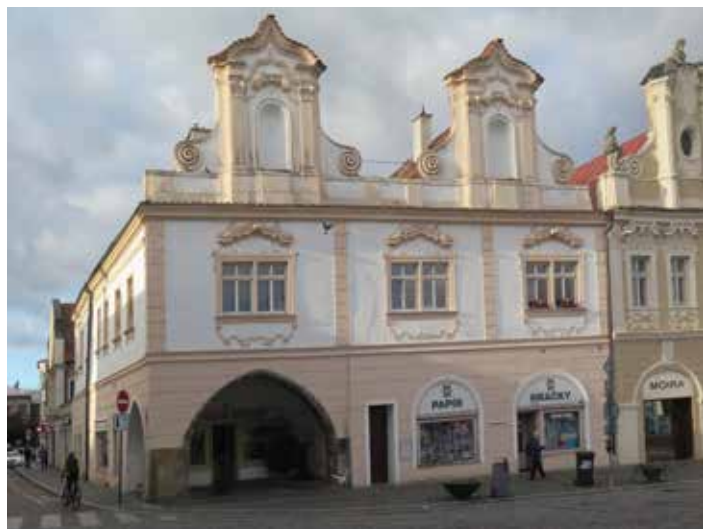
Dům U Černého orla (čp. 91) na Karlově náměstí v Kolíně, kde se narodily všechny děti Mosese Petschka