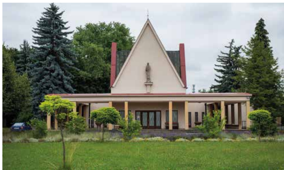
Obřadní síň na městském hřbitově právě prochází kompletní rekonstrukcí. Hotova bude na jaře.