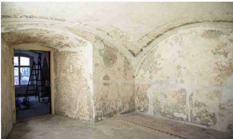
Restaurátorské práce za dohledu Národního památkového ústavu jsou dlouhým a trpělivým procesem. Barva, kterou památkáři zvolili pro budoucí prezentaci, je ale již zřetelná – olivově zelený odstín.