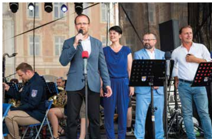
Vítání živé kultury zpátky do ulic města po covidovém sevržení. Úleva, byť možná trochu předčasná.