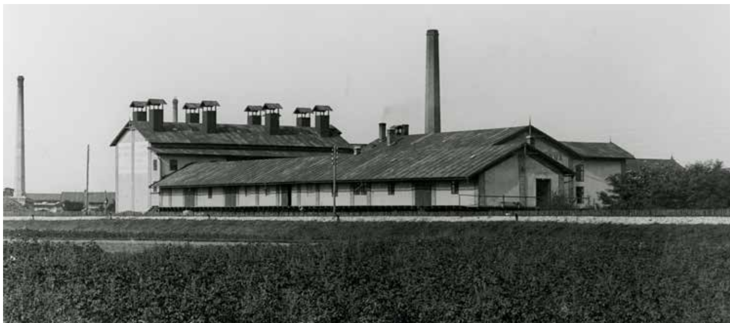
Cikorka – továrna na kávové náhražky v Kolíně na archivním snímku.