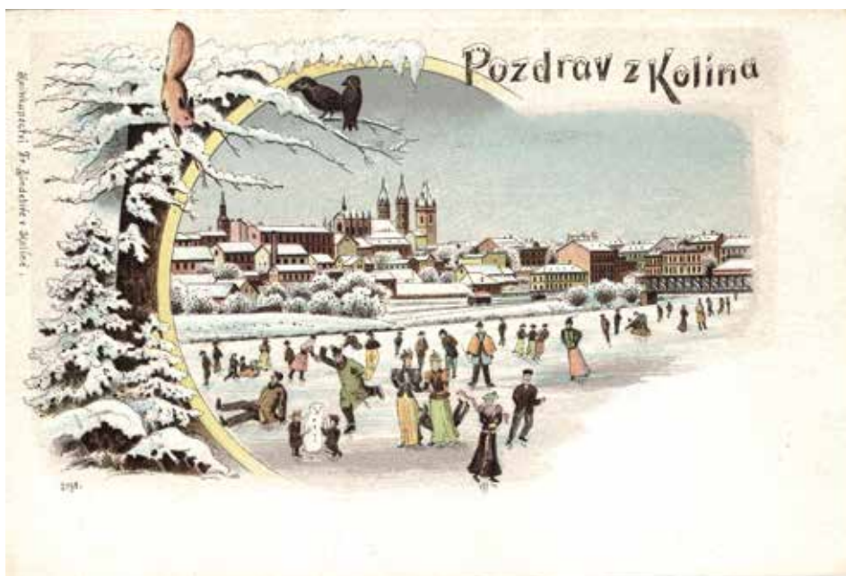
Bruslení na Labi. Pohlednici vydalo knihkupectví Františka Šindelíře před r. 1900. Regionální muzeum Kolín