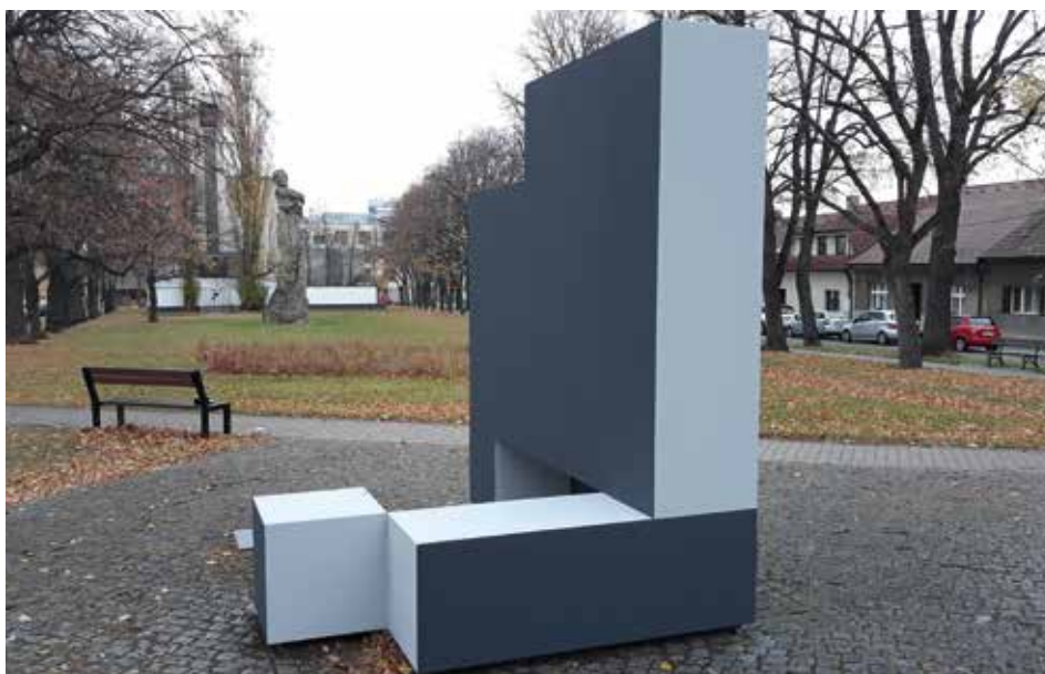
Objekt Jana Kubíčka na Husově náměstí konečně dostal nový kabát

Zhotovení objektu s názvem Dislokace zaplatil městu jeden ze sběratelů Kubíčkovy díla a stálo ho to přibližně šestimístnou sumu. Levně