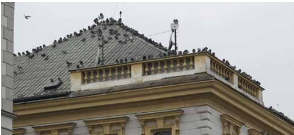
Regulace holubů chrání majetek a především zdraví Kolíňáků. Radnici stojí tři až pět set tisíc ročně.

„Stojí nás to velké peníze. Holubi nám likvidují střechy a fasády, ucpávají dešťové svody. Ročně z jednoho domu odstraníme šestnáct pytlů holubiho trusu, častěji musíme najímat plošinu k čištění žlabů a fasády...“ Takové hlasy se ozývají od majitelů či správců domů na Karlově náměstí. Za jejich stesky je nevyhnutelná otázka: Mohla by radnice v boji proti holubům, přezdívaným též létající krysy, dělat něco víc?