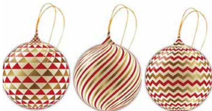
Čokoládové ozdoby z kolínského Chocolandu určené k zavěšení na vánoční stromček