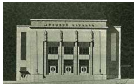
Původní návrh fasády kolínského divadla dle Jindřicha Freiwalda. Jaký byl osud soch ze vstupního portálu? Více na str. 12