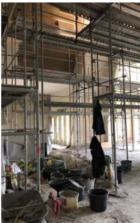
Práce v obřadní sině na centrálním hřbitově jedou na plné obrátky. Hotovo uvnitř by mělo být v lednu.

Jako velmi přínosnou vnímám spolupráci města a neziskových organizací na dlouhodobém řešení dluhové problematiky. V takto náročné době je smysluplná a systémová pomoc při řešení finanční situace jednotlivců zásadní a nutná. Stejně tak vnímám jako přínosnou distribuci tzv. seniorských obálek. Tento jednoduchý dokument mohou využít