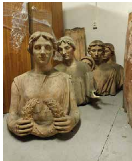
Terakotové (tedy keramické) sochy, sestavené ze dvou částí, byly během stavby divadla skutečně vyrobeny, na svá místa na vrcholech sloupů ale instalovány nikdy nebyly.