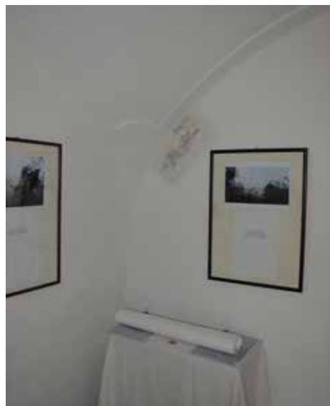
Místnost před započítím restaurátorských prací. Na vzorku lze vidět řadu vrstev pod omítkou.