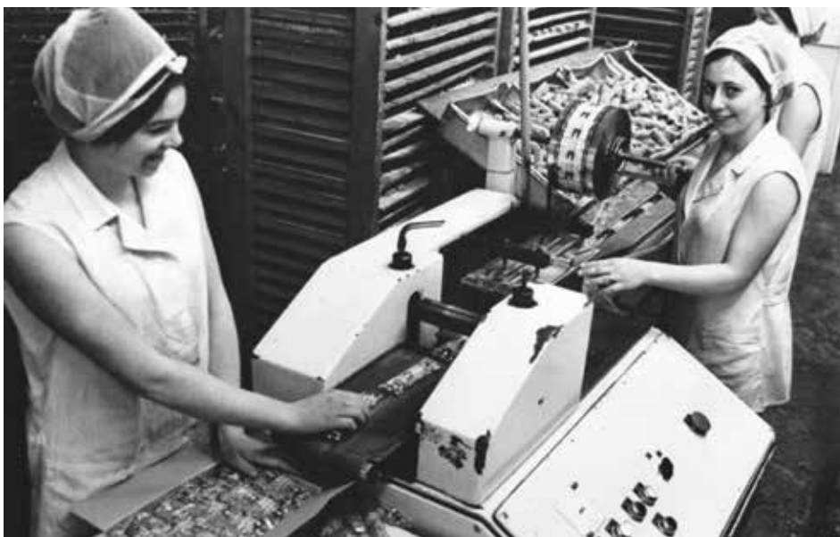
Takto se balily sójové a kokosové tyčinky v éře závodu Soja Kolín

Když v roce 1992 švýcarská firma Nestlé a francouzský koncern Group Danone společně privatizovaly Čokoládovny, došlo následně k prodeji závodu Soja Kolín. Koupila ho společnost Altis a v roce 2014 spojila svou