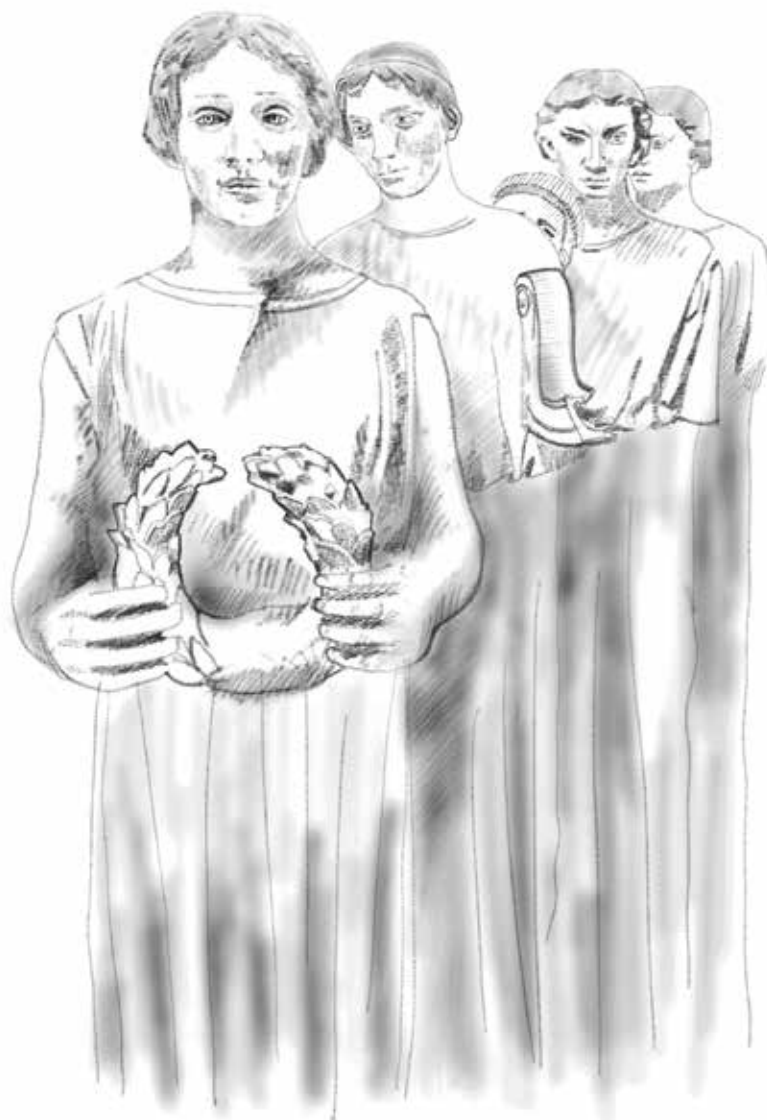
Kresba: David Mateáško

Musíme také nyní zhodnotit jejich technický stav a prověřit možnosti jejich umístění. Důležité je si také uvědomit, že nejsou kompletní. Určitě části jim chybí (části těla, drapérií, ruce, kousky atributů jako je lyra apod.). Pokud se nenajdou např. historické fotografie, které by dokumentovaly jejich originální vzhled, tak bychom se mohli dopustit fatálních chyb a umělecky dochovaná díla zničit. A to určitě nechceme. Pokud tedy nebude