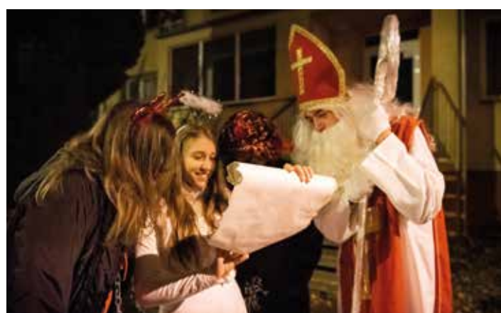
Poslední kontrola hříčů, než děti přijdou s malou dušičkou před dům