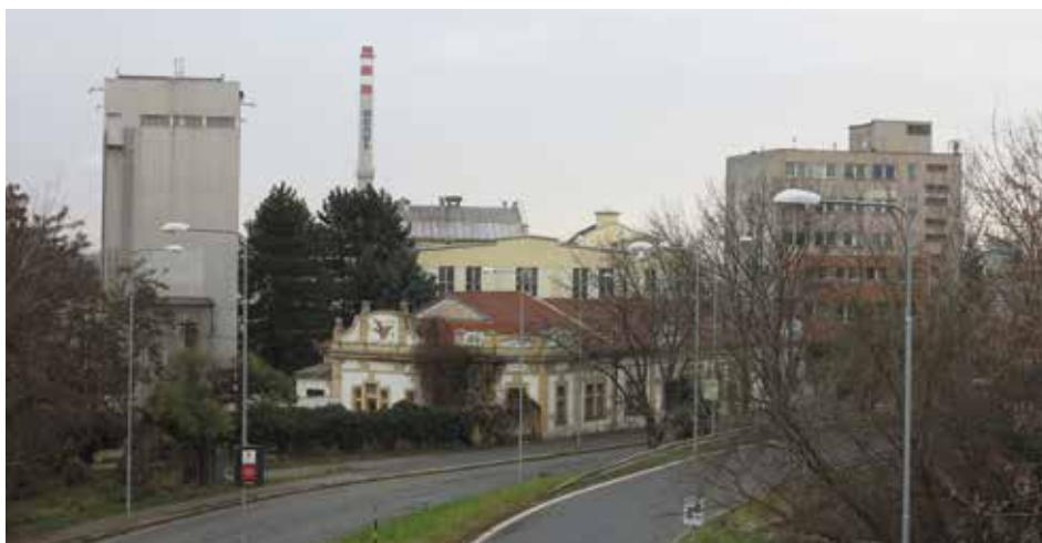
Chocoland, nejvoňavější továrna na kolínském Zálabí