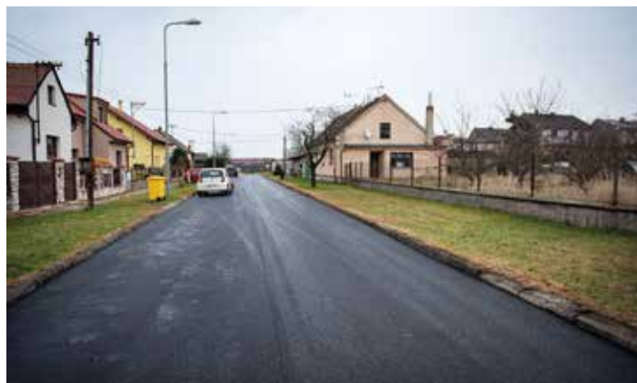
Ulice Mistra Jana Husa v Sendražicích