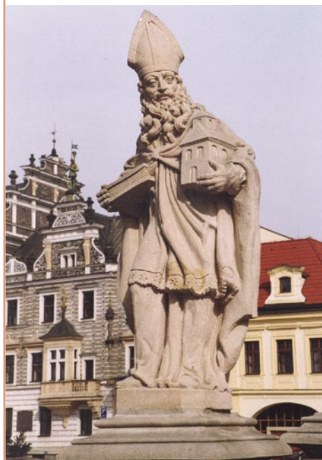
■ Sv. Gothard, ochránce před morem.

Gotharda a sv. Floriána. Každý ze svatých měl chránit město před nějakým neštěstím – Gothard před morem, Florián před