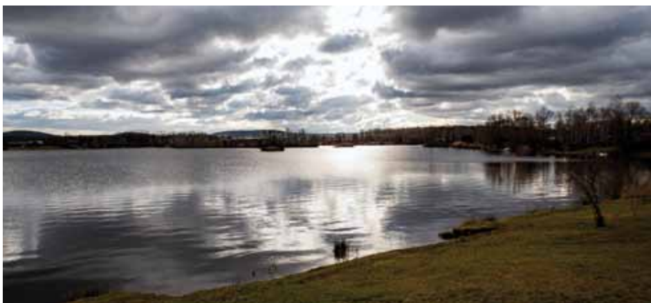
Sandberk. Krásné místo, kam se z Kolína dostanete snadno na kole po Starololínské ulici. Po ukončení těžby je otevřena otázka, jak naložit s rekultivací prostoru. Odlišně to vidí město Kolín a jinak Středočeský kraj. Kvůli danému problému vznikla mezi občany dokonce petice. Více se o této kauze dočtete na str. 17.

Město Kolín v souladu s vyhláškou č. 54/2005 Sb., o náležitostech konkurzního řízení a konkurzních komisích, na základě usnesení Rady města č. 1948/50/RM/2020 ze dne 3. února 2020 vyhlašuje konkurz na obsazení vedoucího pracovního místa ředitele/ky Základní školy Kolín-Sendražice, Hlavní 210, termín nástupu 01.08.2020. Náležitosti přihlášky, termín podání a další podrobné informace najdete na úřední desce města Kolín, v elektronické podobě na www.mukolin.cz , informace na tel. 321 748 228, 321 748 150.