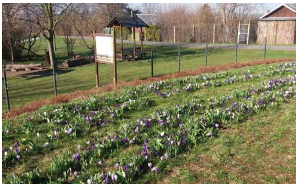
Péče o životní prostředí a zeleň ve městě je jednou z našich priorit. Pečlivě dbáme o každý živý strom, žádný z nich nepadá k zemi zbytečně a lehkově. Současně se snažíme o nové výsadby stromů, ale i květinových záhonů, které vykvétají v různou dobu a které se stávají přirozenou součástí veřejného prostoru.

Bc. Šárka Benešová, vedoucí oddělení správy městské zeleně