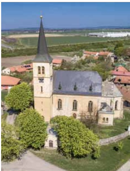
Ovčáry - kostel sv. Jakuba Většího