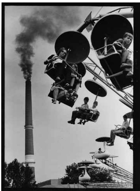
Komín, gondoly a labuť, 1978

budou některé vystavené v Regensburgu. Tedy česky v Řezně. Ostdeutsche Galerie tam vystaví ve čtyřech sálech čtyři české umělce. Kromě táty tam budou mít samostatný prostor ještě Jiří Kolář, Zdeněk Sýkora a Miloš Urbásek.