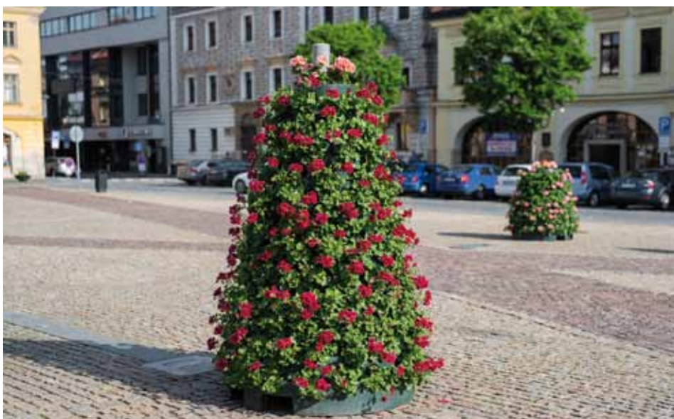
Oddělení se stará nejen o zajištění nové výsadby zeleně na veřejných prostranstvích, ale také, a to je často mnohem náročnější činnost, o pravidelnou údržbu a závlivku.

Jak název napovídá, oddělení má na starost městskou zeleň, je tedy oddělením vykonávajícím veskrze samosprávnou činnost pro město Kolín. A co je jeho náplní? Mezi hlavní úkoly patří správa – dohled nad městskou zelení na veřejných, volně přístupných prostranstvích, jako jsou ulice, parky, náměstí atd., místa kdykoliv volně přístupná veřejnosti. Na volně přístupných veřejných místech dohlédneme na stromy, keře, trávničky či okrasné záhony a květinovou výzdobu. Tuto činnost vykonával Odbor životního prostředí samozřejmě již v předchozích letech. Od ledna 2020 však došlo k organizačním změnám, vzniku oddělení a také k přesunu kompetencí od Odboru správy bytových a nebytových prostor i na veškeré mimo les rostoucí stromy, které jsou na pozemcích v majetku města Kolína s výjimkou smluvně vymezených případů. Jsou to tedy stromy rostoucí na pozemcích v majetku města Kolína, ale ne kdykoliv volně přístupných veřejnosti. Jedná