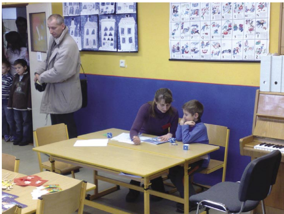
■ Ve dnech 15. a 16. ledna proběhly na všech kolínských základních školách zápisy dětí do 1. ročníků. Výsledky zápisů přinášíme v tabulce.