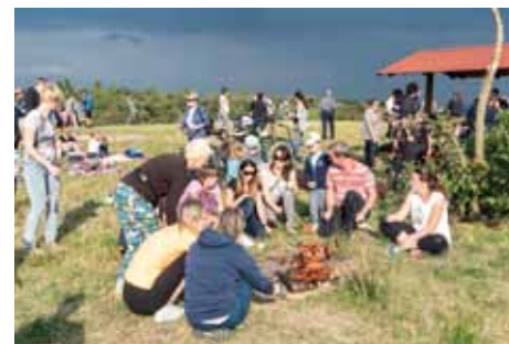
Otevřená ulice na Vinici

Jedinečnost místa ocenil v roce 2014 i Klub českých turistů, který k vyhlídce vyznačil odbočku ze zelené turistické trasy č. 3096 Kolín – Týnec nad Labem – Bernardov. V roce 2017 pak bylo městem Kolín umístěno u vrcholového rozcestníku odpočívadlo a stojan pro kola. V poslední době se zde opakovaně konala Otevřená ulice nebo také křížová cesta římskokatolické farnosti Kolín.