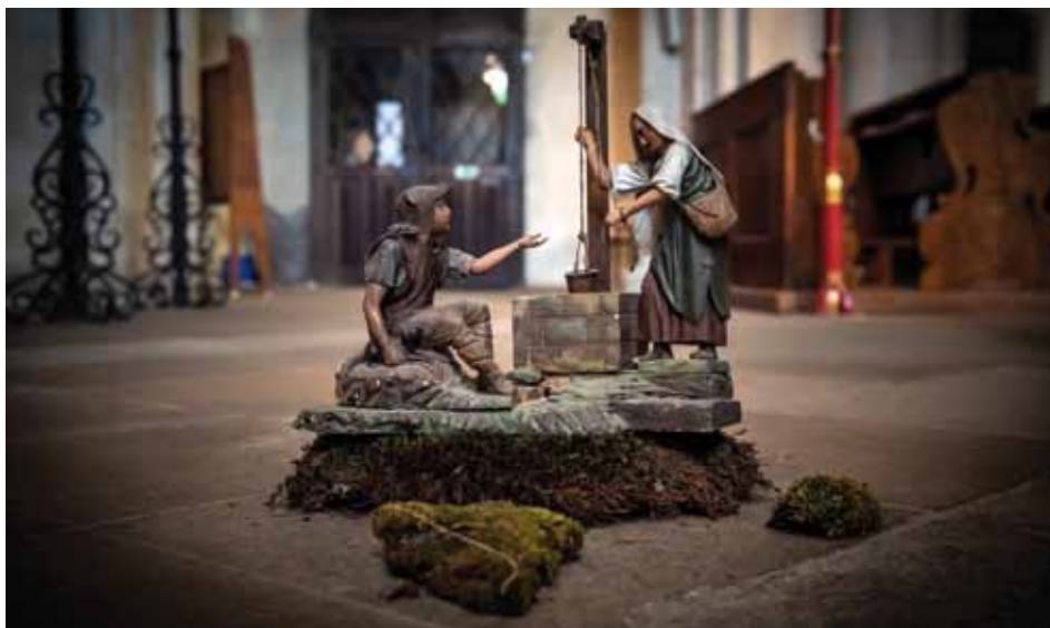
Betlém v chrámu sv. Bartoloměje bude pro veřejnost přístupný a k vidění o Vánocích ve dnech 25., 26., 28., 29., 31. prosince a 1. ledna od 14 do 17 hodin. V ostatních kostelích budou betlémy přístupné pro veřejnost vždy půl hodiny přede mší svatou dle programu. Na fotu figurka z bartolomějského betlému zachycená při instalaci.

Tak jako každý rok je na Karlově náměstí u stromu u betlému instalována schránka na vánoční přání. Vše, co vás v Kolíně tíží či co byste si přáli změnit, můžete napsat a vhodit právě sem. Schránku budeme otevírat na tiskové konferenci společně s novináři 10. ledna 2020.