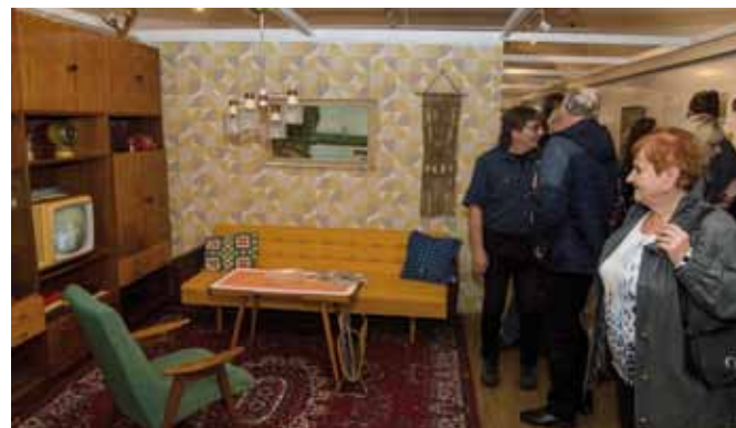
Z vernisáže výstavy „Socialistický sen. Vize a realita“ ve Vejgertovském domě Regionálního muzea na Karlově náměstí. Výstava je k vidění až do 16. 2. 2020.