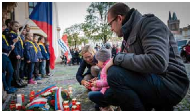
Vedení města položilo u radnice květniny, za přítomnosti čestné stráže kolínských skautů bylo možné u radnice, kde vzniklo pietní místo, zapálit svíčku.