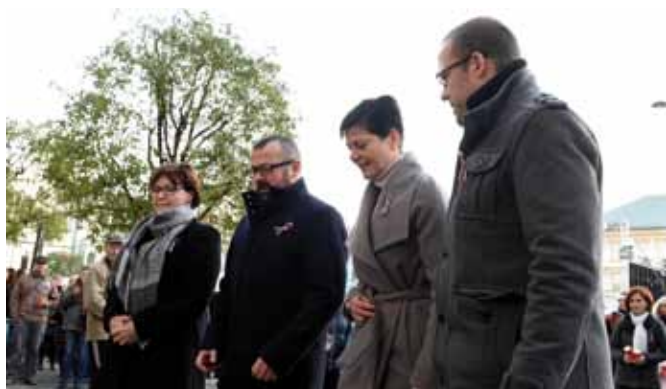
Úvod slavnostního shromáždění v neděli 17. 11. na Karlově náměstí patřil pietnímu aktu.