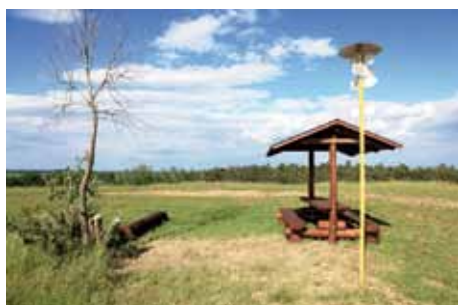
Vinice – zatím ji zdobí turistický ukazatel. Na další využití kopce je aktuálně vypsána veřejná architektonicko-výtvarná soutěž.

Vinice je nápadná svědecká plošina, která geomorfologicky náleží do celku Středolabské tabule, podcelku Nymburská kotlina, okrsku Ovcáarská pahorkatina a podokrsku Býchorská pahorkatina. Tvořena je z turonských slínovců a vápničitých prachovců jizerského souvrství svrchní křídly, kterou kryjí písčité štěrky labské terasy pocházející ze střední doby ledové (středopleistocenní). V okolí pahorku je rozsáhlý, mírně skloněný (kryopedimentní), zarovnaný povrch z období svrchní doby ledové (svrchnopleistocenní). Vrchol leží na katastru města a má nadmořskou výšku 247,8 metrů, přičemž hladina Labe u Masarykova mostu dosahuje 192 metrů nad mořem. Rovinku u Kolína tedy převyšuje o celých 55 metrů.