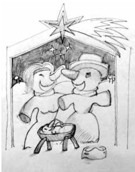
„Na první pohled neviditelné – Kolínský betlém“