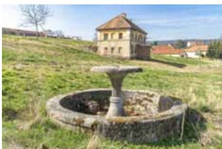
Třebovle - Knížecí dvůr