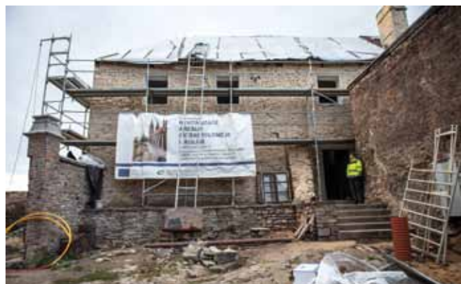
Na staré škole byla provedena demontáž střešní krytiny a dochází k postupné výměně poškozených trámů a latí krovu a souběžně se provádí i výměna poškozených stropních trámů. Dále je prováděna sanace obvodového zdiva a instalace nových oken.