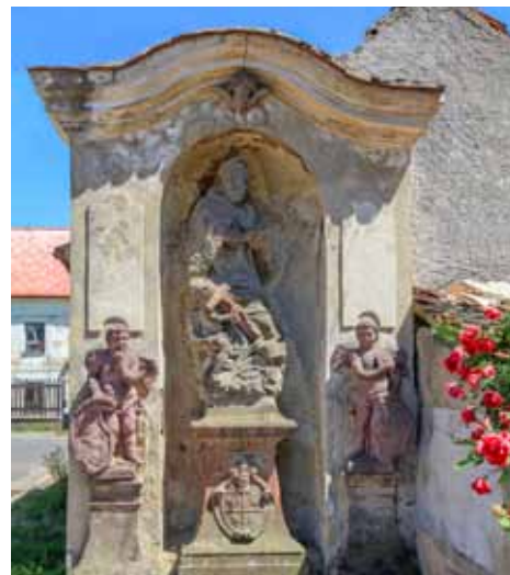
Třebovle - kaple