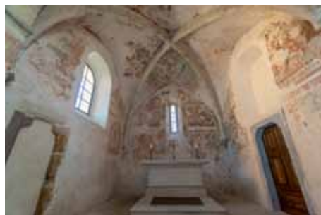
Třebovle - kostel