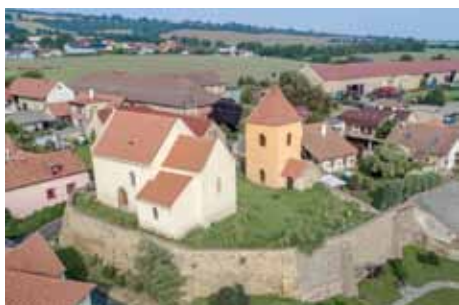
Třebovle - kostel