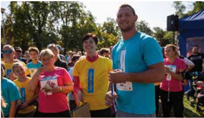
Zlatý olympionik a letošní mistr světa, judista Lukáš Krpálek, v Kolíně