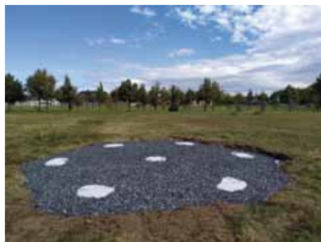
Příprava pro altán u psího útulku

Sad je koncipován jako extenzivní, smíšený s výsadbovým sponem 10 m, a to do čtverce. Vysazeno bude 6 odrůd hrušní (např. Kozačka, Hardyho), 8 odrůd jabloní (např. Spartan, Matčino, Holovouský malináč), 6 odrůd slivoní švestek a renklód (např. Altanova, Domácí velkoplodá), 6 odrůd třešní (např. Karešova, Těchlovan), 4 odrůdy višně (např. Královna hortenzie) a dále 4 ks ořešáku královského a 2 ks morušovníku. V sadu bude umístěn dřevěný altán o průměru 6 m. Vlastní vysazení sadu je plánováno na 18. října 2019 a bude provedeno v rámci spolupráce s Českým svazem ochránců přírody – Arboristickou