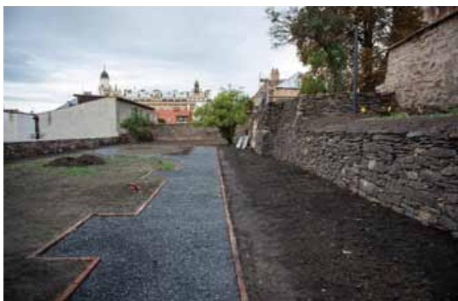
Na spodním parkánu probíhá výstavba nových cest a dále se připravují záhony pro bylinkovou zahradu.