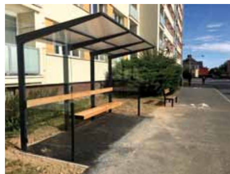
Zastávka MHD u gymnázia ve směru do centra

Pokračujeme v koncepční a moderní obnově autobusových zastávek. V minulém měsíci bylo instalováno šest nových přístřešků na zastávkách Banka (směr centrum), Výfuk (směr Štítary), Na Louži I (směr Veltrubská), Plavecký stadion (směr centrum), Gymnázium (směr centrum) a Zálabská lékárna.