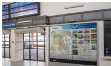
Nádraží – vlevo čištění speciálním strojem, které odstraňuje skvrny na dlažbě či žvýkačky, uprostřed rekonstruovaný interiér haly, vpravo nová informační turistická tabule.