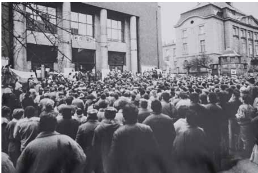
Listopad 1989, shromáždění před divadlem, Kolín