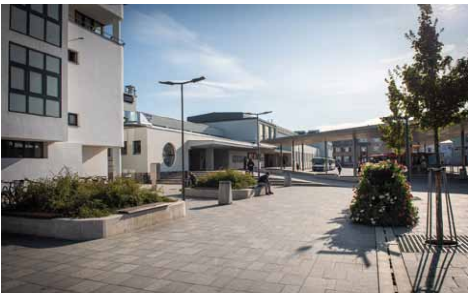
Po rekonstrukci autobusového nádraží byla dokončena a 17. října slavnostně otevřena k užívání i budova vlakového nádraží. Kolín se tak může pyšnit novým moderním terminálem, krásnou funkcionalistickou nádražní budovou, elektronickým informačním servisem o odjezdu vlaků i autobusů a rovněž přilehlým parkovištěm a cyklověží.

Dorostenky získaly na MČR v atletice zlaté medaile a titul nejlepšího týmu