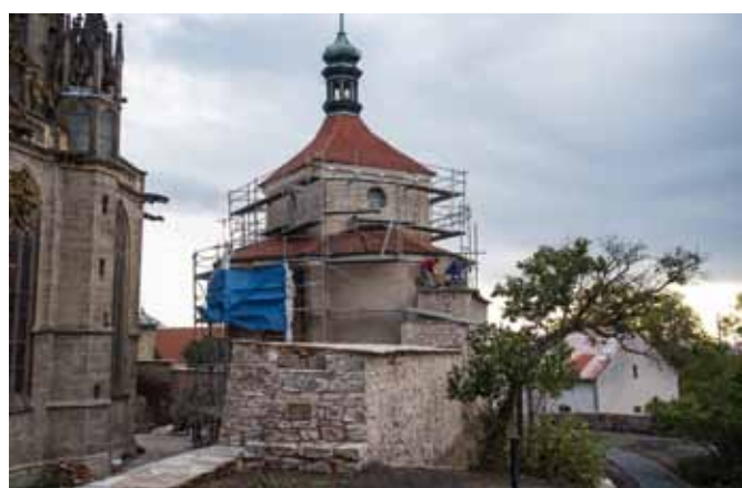
Na objektu kostnice se dokončují venkovní omítky dle původních technologických postupů, na které dohlíží zástupci Národního památkového ústavu. Uvnitř kostnice bylo zahájeno restaurování kosterních pozůstatků.