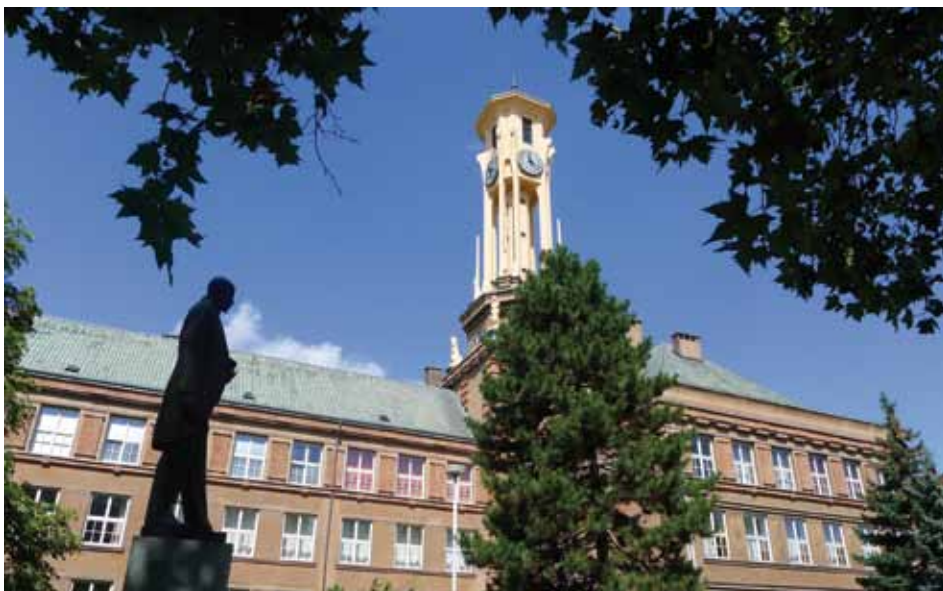
Dalších z velkých investičních akcí města je hotova. Budova Gymnázia Kolín prošla kompletní rekonstrukcí fasády, sgrafit, zdobných provků, okapů atd. Naše úspěšná a prestižní škola dostala odpovídající kabát.