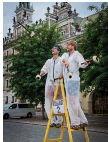
Malíři. BRATŘI V TRICKU