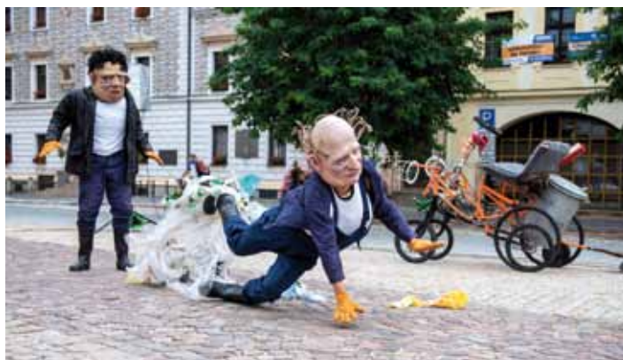
Goršecke Narodnie Akademične Teatr, foto zcela dole: Nautilus: Blackout Paradox