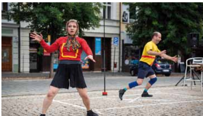
Teatr Novogo fronta, foto prostřední řada: V.O.S.A. Theatre