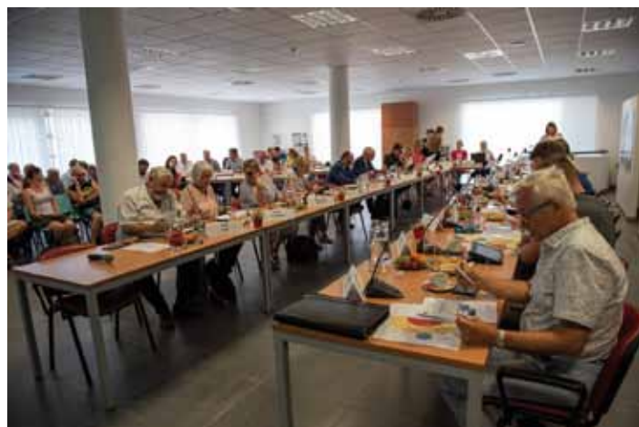
Zasedání Zastupitelstva města Kolína. U stolu do tvaru U sedí zastupitelé města, v pozadí stranou vedoucí odborů města, kteří předkládají své návrhy. Zasedání je veřejné, je zde tedy vyčleněn prostor i pro veřejnost a novináře.