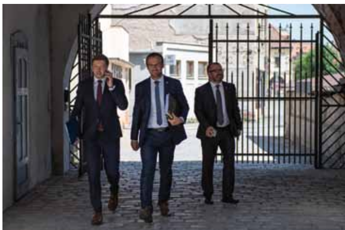
Pondělí 24. června. Starosta Vít Rakušan, místostarostové Michael Kašpar a Michal Najbrt přichází do CEROPu Kolín, kde za pár chvil začne zastupitelstvo, na kterém Vít Rakušan rezignuje na svou funkci a bude se volit nový starosta města.