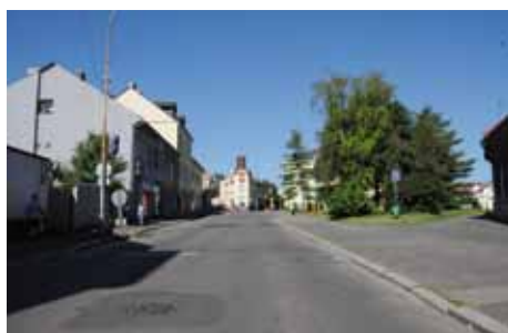
Pražská před rekonstrukcí

Porota návrh ohodnotila takto: „Kultivovaný návrh, který porotu zaujal svou adekvátností, komplexností i přesvědčivou prezentací. Porota hodnotí kladně prostorové uspořádání s obnovením historické stopy Sluneční ulice a scelení navazujícího veřejného prostranství v jednu kompaktní plochu. Navržená mlatová plocha se sakurami vytváří jednoduchými