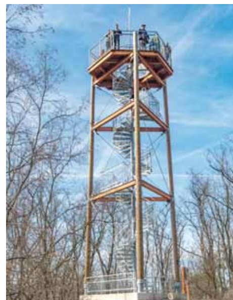
Bedřichova rozhledna - 60 schodů, 14 metrů vysoká, celoročně přístupná

západním průčelím kostela stojí socha sv. Jana Nepomuckého z roku 1854, přenesená sem v roce 1960 od bývalé fary. Krátkou procházkou po žluté turistické značce se vydáme na nedaleký vrch Bedřichov (279 m. n. m.), který je výraznou dominantou této části Kolínska. Na jeho vrcholu stojí od roku 1841 památník na počest pruského krále Fridricha II. (Bedřicha) Velikého, jehož stavbu podle plánu architekta Václava Weinzettla financoval opět Václav Veith. Na památníku byla 18. června 2005 slavnostně odhalena nová pamětní deska s českým, německým a anglickým textem, vyhotovená podle návrhu akademického