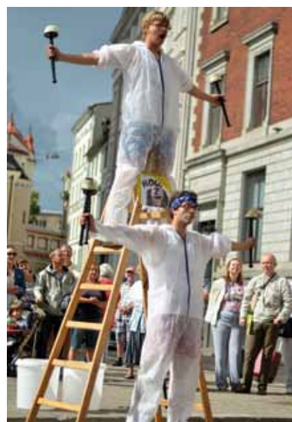
BRATŘI V TRICKU