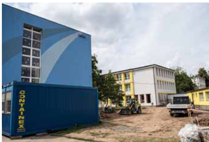
ZŠ Masarykova a Bezručova: za pár měsíců zde vyroste zcela nový pavilon