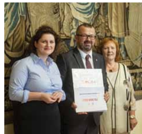
Místostarosta Michal Najbrt s ministryní práce a sociálních věcí Janou Maláčovou

organizací, která zajišťuje péči a pomoc seniorům jsou Městské sociální a zdravotní služby. Rozhodně nemohu zapomenout na všechny, kteří organizují volnočasové aktivity v klubech pro seniory i mimo ně,“ uvedl Michal Najbrt.