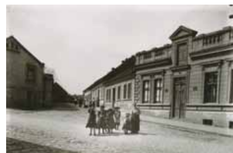
Odbočka do Sluneční ulice kolem r. 1910

výrazovými prostředky dostatečně atraktivní a příjemný prostor. Zdařile je řešen i plácek na nároží s ulicí Kmochova. Celkově vhodné zvolené materiály, zeleň i její umístění. Lze předpokládat standardní náklady na údržbu. Dopravní řešení je principiálně správné, nicméně bude vyžadovat určité úpravy. Diskutabilní je zúžení uličního profilu v místech přechodů. Návrh nezohledňuje bezbariérové úpravy, které promluví do detailní podoby výdlažeb. Pozornost bude třeba věnovat řešení cyklistické dopravy v souvislosti s šířkou jízdního pruhu. Návrh kvalitativně výrazně převyšuje ostatní. Po zapracování připomínek porota doporučuje návrh k realizaci.