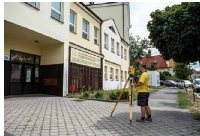
ZŠ Mnichovická: nástavbou vznikne několik nových učeben