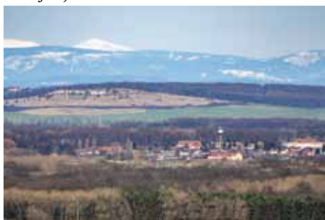
Výhled na Velký Osek, v pozadí Krkonoše

Původ názvu: Název obce pochází od toho, že osadníci založili novou ves na jiném místě, chráněném před labskými povodněmi (původní poloha obce – viz historie). Index I obec odlišuje od dalších Nových Vsí na okrese Kolín (Nová Ves II u Rostoklat a Nová Ves III u Svojšíc).