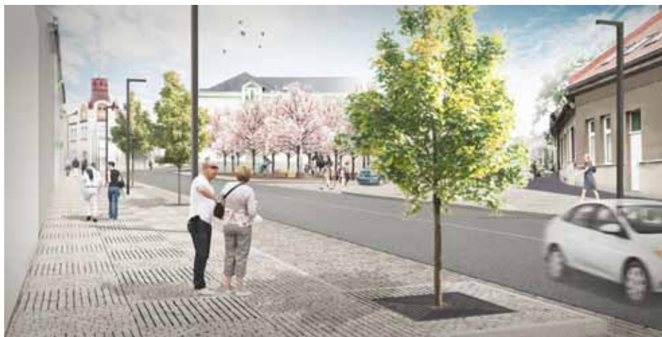
Vizualizace vítězného návrhu