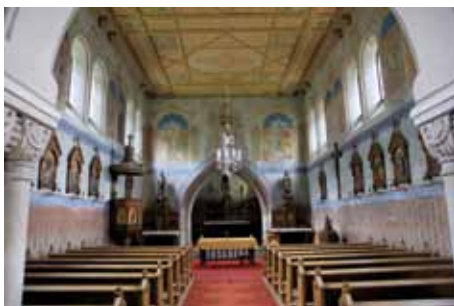
Interiér kostela sv. Václava v Nové Vsi I.

Nehledě na nejstarší písemné doklady byl katastr Nové Vsi I osídlen od nepaměti. To dokládají četné archeologické nálezy, mezi nimiž čestné místo zaujímá unikátní nádoba kultury s lineární keramikou (cca 5 700 př. n. l.) s vyobrazením lidské postavy. Vzhledem ke zvýraznění prostoru břišních partií se nejspíše jedná o ženu – matku, která v neolitu zaujímal důležitý postavení v rámci rodu. Tento významný archeologický nález je k vidění ve sbírkách Reg. muzea v Kolíně. Z památek, které si můžete prohlédnout na místě samotném, je tou nejvýznamnější bezesporu kostel sv. Václava. Stojí uprostřed návsi (Václavské náměstí) někdy od konce 13. století, a přestože byl mnohokrát přestavěn a upraven, svým charakterem náleží do skupiny středočeských kostelů s chórovou věží. (Tedy věží ve východní části stavby nad presbytářem, a nikoliv, jak je nejobvyklejší, nad opačným západním průčelím.) Iniciátorem stavby raně gotického svatostánku byl tehdy Sedlecký klášter, ale jeho současný vzhled mu vtisklo až 19. století. Nejprve ho nechal v letech 1835-36 přestavět empírově Václav Veith, tehdejší majitel kolínského panství. Další přestavby, tentokrát v pseudorománském slohu, se kostel dočkal v roce 1866. V letech 1897-99 pak ještě provedl kolínský stavitel Jan Sklenář úpravu vzhledu střech věže a lodí a taktodokončený kostel byl v prosinci roku 1899 vysvěcen. V r. 2008 byla zahájena postupná rekonstrukce vnější i vnitřní výzdoby kostela. Z původní gotické stavby se dochoval