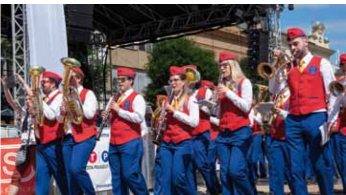
Zástupci mládežnických dechových orchestrů, ZUŠ Krnov