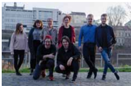
Organizační tým Kolínského Majálesu