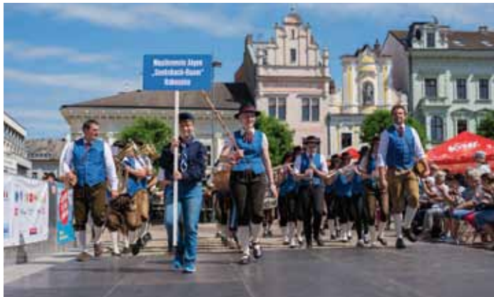
Festival přivítal zahraniční orchestry z Rakouska, Mexika, Maďarska a Chorvatska