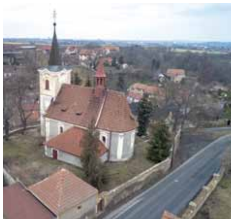
Nebovidy - kostel