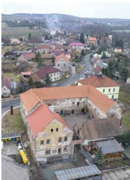
Nebovidy - obec s tvrzí a kostelem v pozadí

Nebovidy se poprvé připomínají v roce 1268, kdy zde měl majetek Kunata z Nebovid (Chunatus de Nebewige), v díle Augusta Sedláčka Místopisný slovník království českého je uvedeno starší datum, rok 1235. Klíčovou roli při vzniku obce a jejím dalším rozvoji měl zemanský rod pánu z Nebovid se stříbrným, nakoso položeným pruhem nebo břevnem v červeném poli. Na počátku 14. století ves náležela Pavlovi z Nebovid (uvádí se v letech 1325–27), poté byly Nebovidy rozděleny na dvě části a v každé z nich vznikla tvrz. Tím se na dalších 100 let také rozdělila historie obce. V roce 1473 spojil obě části Nebovid Jindřich z Nebovid, předek zemanské rodiny Chotouchovských z Nebovid sídlící na horní nebovidské tvrzi Okrouhlá, a obec jako jeden celek prodal Janu Plzákovi