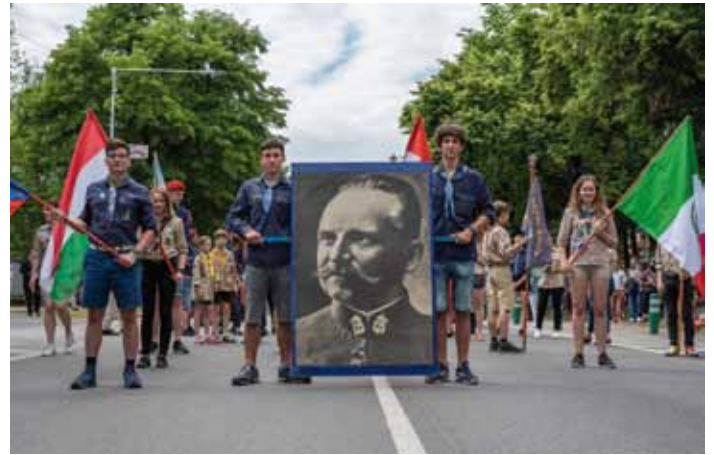
Sobotní průvod městem s tradiční fotografií Fr. Kmocha a čestnou gardou skautů