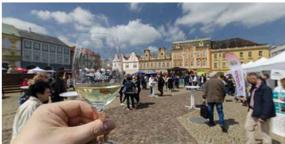
18. května se na Karlově náměstí konala pro Koliňáky zcela nová akce - Vinný košt. Návštěvníci měli možnost ochutnávat různé druhy vín od deseti vinařů z festivalové skleničky, kterou si bylo nutné na začátku za 100 Kč zakoupit a zůstala pak jak suvenýr. Ten den probíhal na náměstí i hudební festival Southern Rock & Blues. Náměstí bylo plné spokojených návštěvníků až do večerních hodin.

Veškeré chodníky jsou vydlážděny a probíhá jejich kontrola. Na základě provedené kontroly byla vybrána místa, která je nutné lokálně předláždít (špatný sklon, velké nebo malé mezery, propady). V nově vzniklém parku ve Sluneční ulici probíhá výsadba chybějících stromů a osazování mobiliáře. Následně bude probíhat pokládka mlatového povrchu a instalace prvků veřejného osvětlení. Zhotovitel předpokládá, že veškeré práce budou dokončeny do konce června.