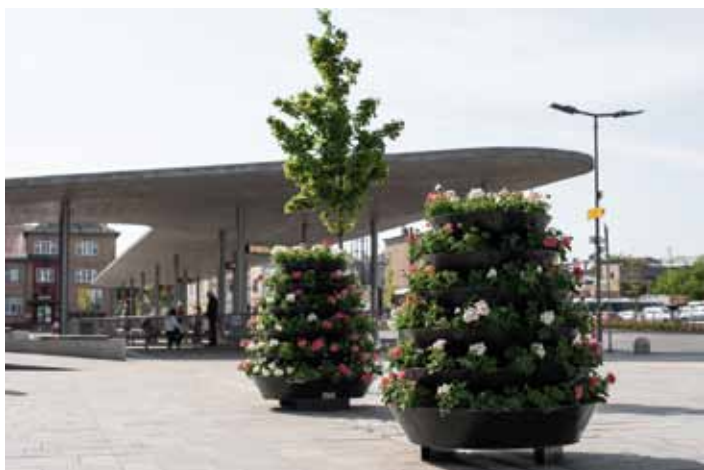
Po Kolíně byla rozmístěna květinová výzdoba, která oživuje celkem 17 lokalit. Rozmístěno je 26 kusů pyramid, nejvíce - šest - se jich nachází na Karlově náměstí. Na Masarykově mostě a v centru města jsou také rozmístěny květinové závěsy.