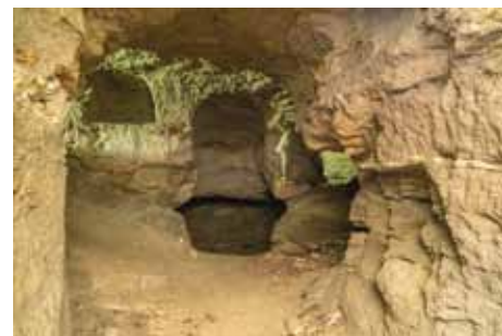
Nebovidy - dolní tvrz - sklepení ve skále

účelu sloužila až do 90. let 20. století. V roce 2001 bylo na poslední chvíli zabráněno jejímu zboření, když byla krátce před demoličním rozhodnutím zapsána mezi nemovité kulturní památky. Tvrz je v majetku obce, která zde od roku 2008 s pomocí spolku Nebovidská tvrz realizuje průběžné opravy. Tvrz včetně gotického sklepení a muzea venkova si můžete prohlédnout v rámci některé z pořádaných akcí nebo kdykoliv po předchozí domluvě na nebovidskatvrz@centrum.cz . Po prohlídce tvrže rozhodně stojí za návštěvu i nedaleký kostel sv. Petra a Pavla, jehož původ sahá až do 12. století, kdy byl vystavěn v románském slohu. Z této doby se dochovala pouze apsida v závěru stavby, jinak byl celý několikrát přestavěn goticky, renesančně i barokně, až nakonec získal dnešní podobu v letech 1757–58, kdy byla před západní průčelí přistavěna věž a celý kostel dostal jednotné barokní fasády. Uvnitř je v lodi nástropní freska z roku 1772, znehodnocená přemalováním ve 20. století, a jednotné pseudorenesanční