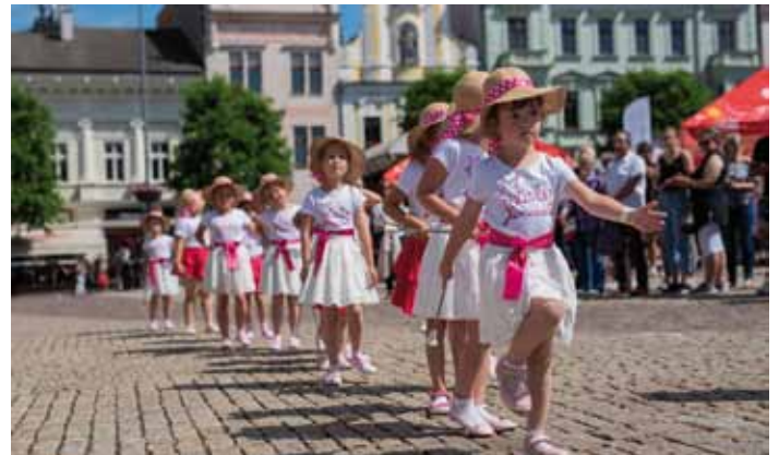
Malé i velké mažoretky. Ty nejmenší byly Hvězdičky z Konárovic