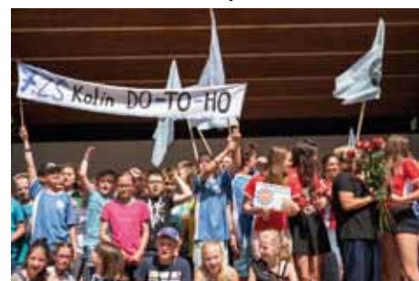
Letošní vítěz, ZŠ Masarykova (7. ZŠ Kolín)

Asi nejsem sám, kdo samozřejmě se sportovní šikovností a kondicí většiny současných dětí spokojen není, a je to vidět i v jednotlivých soutěžích. Já mám největší přehled v atletice, takže vím, že školy kolikrát reprezentují třeba v bězích děti, které ani nedokáží uběhnout celou trať najednou. Je to i příčina některých úrazů, třeba už ve zmíněné cyklistice, protože je samozřejmě velký rozdíl mezi výletem s rodiči „na soutok“ a závodem v terénu. Z mého pohledu je příčina tohoto stavu v rodině. Jen málo dětí je ke sportu rodiči vedeno, to mu spíš zaplatí členství v nějakém klubu, tam se ale mnohdy už nedá to, co rodiče