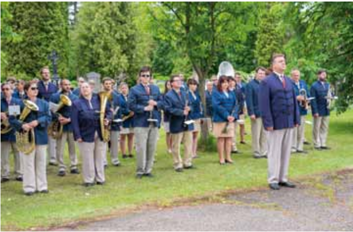
Městská hudba Františka Kmocha při pietním aktu u hrobu Františka Kmocha