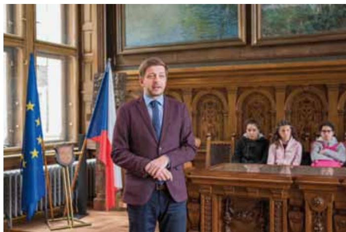
Kolínské školy se velmi aktivně se svými žáky zapojují do projektů ERASMUS. Díky tomu naše děti jezdí na zkušenu na výměnné pobyty do zahraničí a stejně tak přijíždějí zahraniční studenti poznávat Kolín. V posledním měsíci zavítaly do Kolína hned dvě skupiny, a to z projektů, ve kterých je zapojena ZŠ Ovčářská a ZŠ Mnichovická. Starosta města vždy studenty a učitele rád přivítá na půdě radnice.