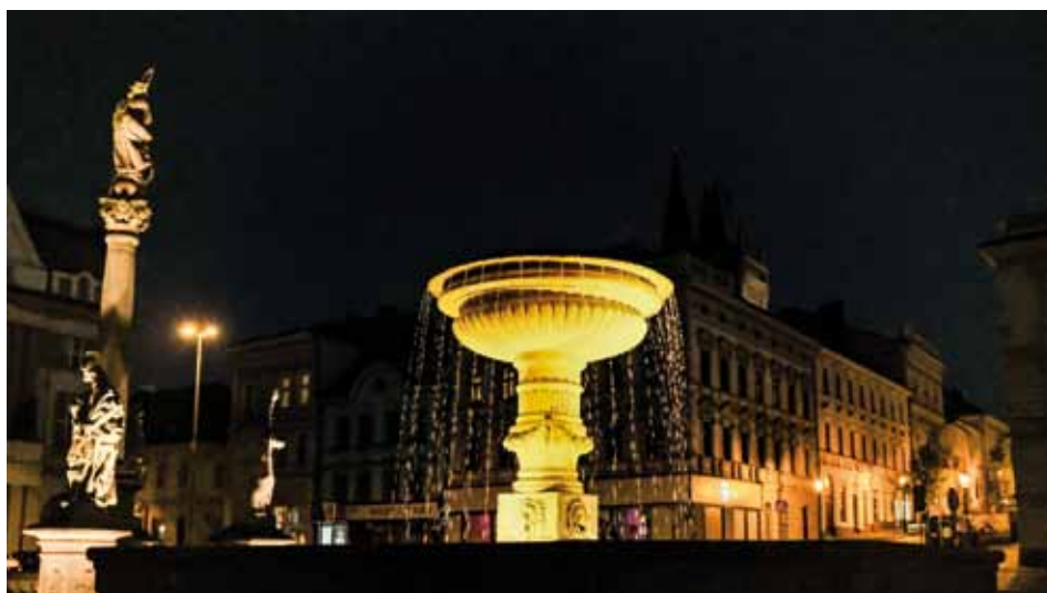
Kašna na Karlově náměstí opět ve své plné kráse. V uplynulém období prošla kašna drobnými opravami. Byla provedena výměna stávajícího osvětlení. Dále proběhla kompletní výměna technologické části (tj. čerpadla, filtrace, chemická úprava vody) a výměna rozvodů vody a elektriny.

61. ročník běžeczkého závodu Kolín - Velký Osek - Kolín