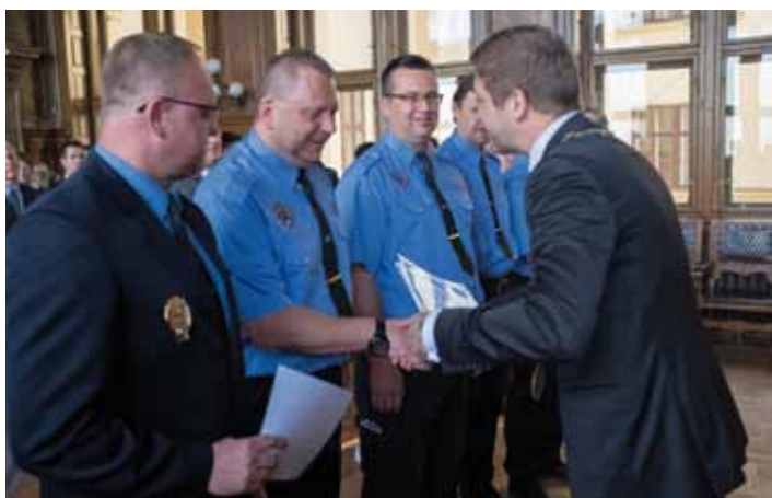
8. května, na státní svátek, předal starosta Vít Rakušan ocenění vybraným městským policistům. Ocenění a medaile byly předány i osobnostem ve složkách záchranářů, hasičů a policistů z rukou ředitelů krajských organizací.