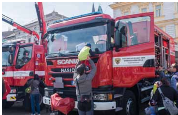
Plocha Karlova náměstí patřila na Den záchranářů tradičně ukázkám techniky záchranných složek - hasičů, policistů a záchranné služby. Prolézt kabinu sanitky, hasičského vozu, zahoukat si sířenou, sednout na policejní motorku, to je sen každého kluka.