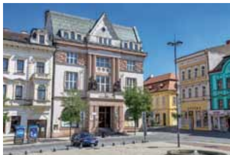
Budova Městské spořitelny - dnes Městský úřad Kolín

ly uzavřené bloky. Tyto kolonie byly postaveny v letech 1922–24 a nalezneme je v ulicích U Borků (čp. 651–662 a 679–686), U Hříště (čp. 674–676), Okružní (čp. 619–621, 647–650 a 678), Horského (čp. 622–633), Jablonského (čp. 633–637), U Přejezdu (čp. 646–735) a Sadová (čp. 668–673). Jeho elegantní domky se vyznačují členitým průčelím, vysokými štíty, kamennou podezdívkou a výraznými bílými římsami, sloupky a šambránami nad okny. Ve větší míře se tyto jeho domy dochovaly dodnes, byť mnohé po více či méně radikálních přestavbách, které jejich původní ráz bohužel pozměnily. Ale naštěstí ho neseřetly docela. Nejhůře tak dopadla řada domů v ulici Horského, zcela zničená během bombardování při třetím náletu na Kolín 15. března 1945. Na jejich místě pak vyrostly zcela nové moderní řadovky, ovšem s výjimkou nárožních domů, z nichž ten do Okružní ulice