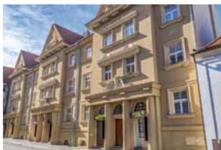
Činžovní domy v ulici Na Hradbách

věžňů, je zdobeno jedinečnou a neobyčejně půvabnou fasádou nezaměnitelných rondokubistických tvarů. Domy se líbily, a tak není divu, že se mu zakázky jen hrnuly. Architekt byl vyzván k vypracování návrhu obytných kolonií na Zálabí, které částečně (navzdory před-sudkům) navrhl jako řadové. Freiwald ovšem ponechal volná nároží, do kterých umístil volně stojící jednopatrové domy, aby nevznika-