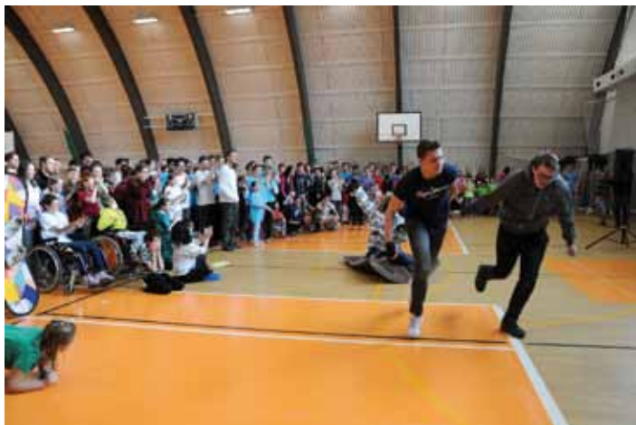
14. února se v hale v Borkách uskutečnil již 16. ročník Her pro radost, které pro handicapované sportovce uspořádali učitelé ze Základní, mateřské a praktické školy v Kolíně. Den plný her a zábavy si užilo 300 nadšených klientů mnoha sociálních zařízení Středočeského kraje.