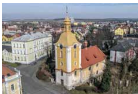
Komunitní centrum vznikne v prostoru za kostelem.

Výstavba komunitního centra je již několik let existující společný projekt Římskokatolické farnosti Kolín a Farní charity Kolín. Cílem je nabídnout lidem místo pro setkávání a pro budování života obce (či – chcete-li – komunity). Když nahlédneme do historie, uvidíme, že již v roce 2016 farnost darovala část pozemku na bývalém hřbitově u kostelíčka na Zálabí farní charitě a charita dala vypracovat stavební projekt, podala žádost o dotaci v rámci evropského programu IROP a uspěla. Na stavbu získala dotaci 14 mil. korun. Nic nebránilo záměrům výstavby centra, protože na základě územního plánu města Kolína není bývalý hřbitov u kostela sv. Víta pohřebišťem. Je tomu tak už řadu let. Ostatně, dobře si uvědomujeme, že na konci osmdesátých let, když byl hřbitov rozdělen na dvě části a značně zdevastovaný kvůli výstavbě mostu, se - dle našich poznatků - nedělal žádný archeologický průzkum ani exhumace lidských ostatků. Ty se jen zahrnuly anebo vyvezly se zemí pryč. Také hřbové zařízení bylo zahrnuto na mnohých mís-