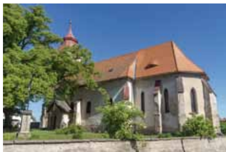
Žiželice - kostel sv. Prokopa