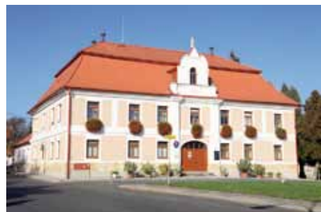
Žiželice - radnice

První zmínka o Žiželicích je z roku 1052, později patřily k panství hradu v nedalekém Hradištku. Za pomoc při jeho obléhání byly v roce 1321 povýšeny na město, jehož práva potvrdil král Vladislav Jagelonský v roce 1502, kdy Žiželice obdržely rovněž právo trhové, mýtné a hrdelní. Ačkoliv v 17. století připadly k chlumeckému panství Kinských, veškerá stará práva si město udrželo i v nadcházejícím období;