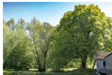
Žiželice - památná lípa na břehu mlýnského náhonu

Bez povšimnutí by neměl zůstat ani železobetonový silniční most přes Cidlinu z roku 1923, postavený podle projektu technického oddělení pro stavby pozemní, silniční a mostní Zemského správního výboru v Praze. Jelikož se jedná o poměrně významnou technickou památ-