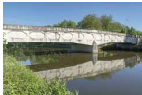
Žiželice - most přes Cidlinu

Nepomuckého z let 1710-50 od neznámého autora, socha sv. Václava od významného českého sochaře Vojtěcha Suchardy z roku 1901 a nebo památník padlým z roku 1922 od dalšího významného kameníka Františka Bílka (od něho je i socha mistra Jana Husa v Kolíně).