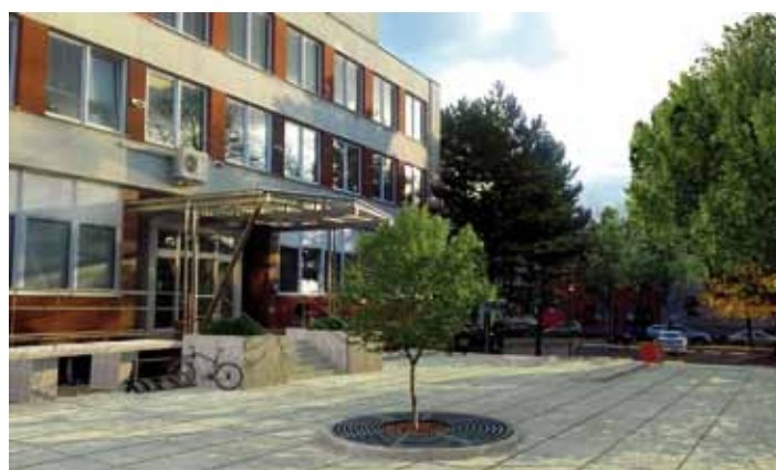
Vizualizace plánovaných úprav před poliklinikou.