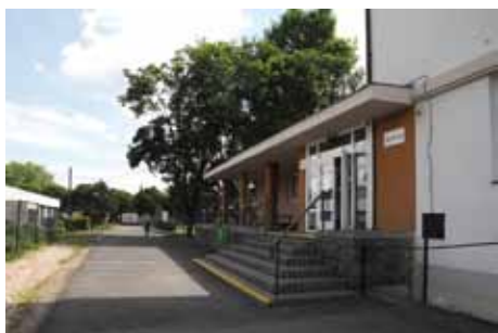
Areál ZŠ Prokopa Velikého

Z dalších větších investic bych rád poukázal na vybudování zcela nového multifunkčního prostoru (pro cvičení, besídky a setkávání) v prostorách MŠ Bezručova – po bývalém, dnes již nevyužívaném bytu. Velkou změnou projde areál ZŠ Prokopa Velikého, kde se propojí „internát“ s halou BIOS vstupní chodbou a novým foyer. Celková výměna podlahy bude provedena v tělocvičně ZŠ Masarykova. Pracujeme též na kompletní přestavbě jídelny a školní kuchyně ZŠ Kmochova.