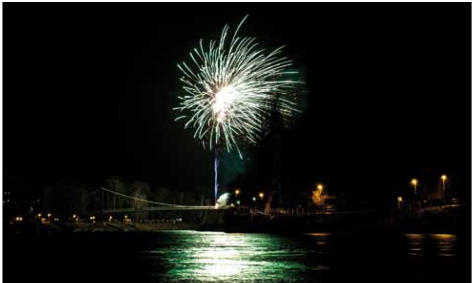
Novoroční ohňostroj 1. 1. 2019.

Žáci „Pětky“ obsadili první místa soutěže Dětský čin roku