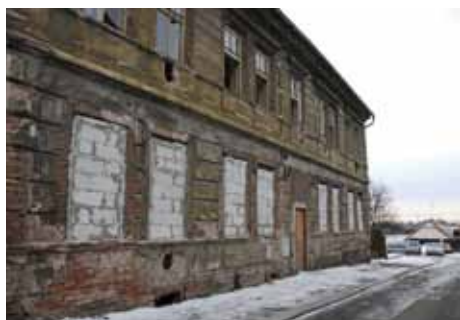
Objekt ve Školské ulici určený k demolicí

Víme, že požadavky na parkování nejen ze stran obyvatel, kteří pravidelně dojíždějí za prací mimo Kolín, ale i požadavky pro každodenní parkování v širším centru nejsou plně uspokojeny, proto připravujeme v blízké