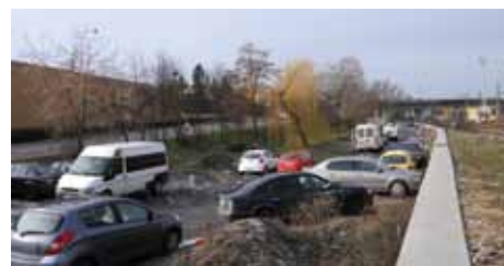
Nové parkoviště vznikne v Rorejcově ulici

V ulici Rorejcová, která vede od vlakového nádraží okolo obchodního centra Futurum směrem k Novému mostu, dojde v tomto roce k vybudování parkoviště s kapacitou minimálně 80 parkovacích míst. Jedná se konkrétně o prostor, který leží naproti výjezdu z OC Futurum do ulice Rorejcová. Aktuálně se zde nachází plocha, kde se parkuje na hlině. Investo-