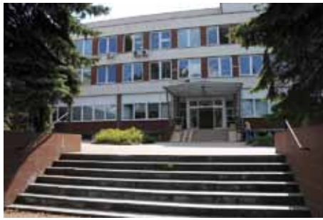
Prostor před poliklinikou

V současné době se řeší vyjmutí ze ZPF a majetkové vztahy. Po vyřešení bude zahájena realizace. Investice by měla nahradit stávající antukové tenisové hřiště novým víceúčelovým sportovním hřištěm s umělým povrchem z polyuretanu, na kterém budou vyznačena hřiště