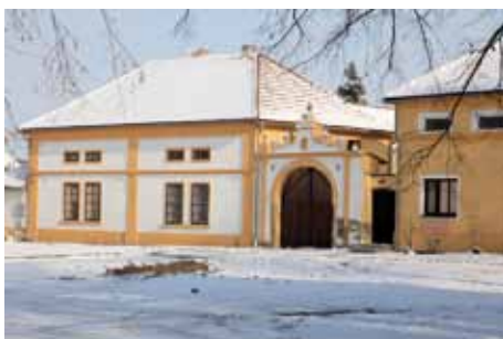
Rostoklaty - statek č.p. 6