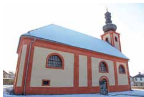
Rostoklaty - kostel sv. Martina