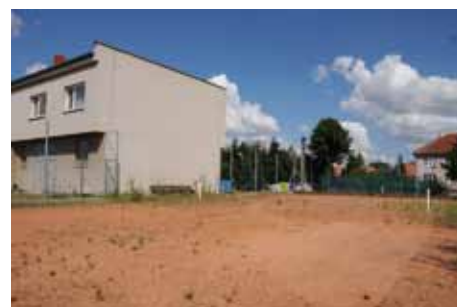
Hřiště v Zibohlavech

Bude rekonstruován povrch komunikace a bude vyměněno veřejné osvětlení. Akce ze strany města bude realizována až po akci