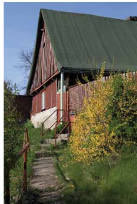
Radovesnice I - dům čp. 32

je v regionu ojediněle zachovaná roubená chalupa čp. 32 z poloviny 19. století, kterou naleznete v Úzké ulici. S Kolínem mají Radovesnice I společný tzv. „Radovesnický vo-