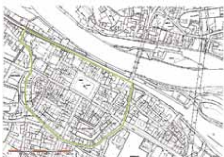
Hranice MPR Kolín

Město Kolín, Odbor dotací a veřejných zakázek, informuje vlastníky kulturních památek, které se nacházejí na území MPR Kolín, o možnosti požádat o finanční příspěvek z Programu regenerace městských památkových rezervací a městských památkových zón pro rok 2019. Příspěvek je určen výhradně na stavební obnovu a restaurování kulturních památek (zapsaných v Ústředním seznamu kulturních památek ČR) pro zachování kulturního dědictví pro další generace.