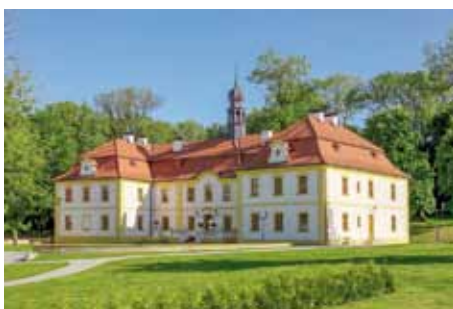
Radovesnice I - zámek

Radovesic až po Martina Smolika z Radovesic, vzpomínaného v roce 1515. Církevní část vsi zapsal v roce 1436 císař Zikmund ke kolínskému panství Bedřicha ze Strážnice, ale na počátku 16. století získali sjednocenou obec Maternové z Květnice, kteří zde postavili první tvrz. V období třicetileté války byly Radovesnice těžce poškozeny, a když je v roce 1651 získal Václav Jiří ze Šternberka, musel je celé obnovit. Radovesnice si mimochodem velmi oblíbil a ke stáru se zde usadil se svou druhou manželkou. Později se majitelé obce střídali, až ji v roce 1759 koupil nejvyšší pražský purkrabí Filip Krakovský z Kolovrat. Jeho syn ji prodal v roce 1795 Janu Václavovi z Rummerskirchu a po dalších několika transakcích je nakonec v roce 1816 získal pruský hrabě Jakub Alexander Pourtalés-Gorgier, součástí jehož pan-