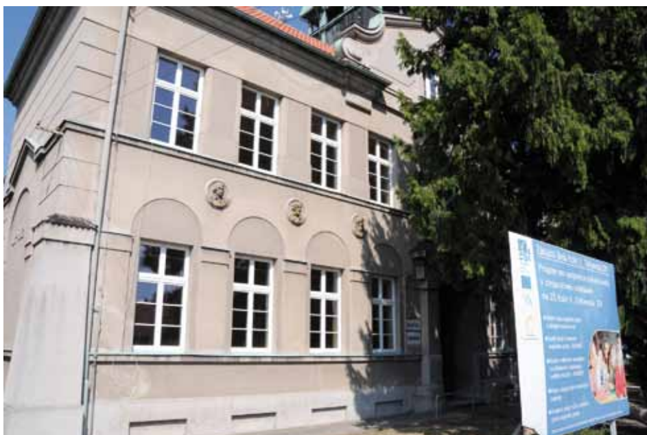
Na ZŠ Sendražice byla vyměněna všechna okna

Samostatnou kapitolou je velká investice – nový pavilón MŠ Chelčického. Další velký dotační úspěch pro Kolín a naše děti. Z předpokládané investice zhruba 16 milionů Kč bude dotace tvořit asi 14 milionů! Přimo v areálu se staví nová budova, která pojme dvě zcela nové třídy mateřské školky. Dojde tak k navýšení kapacity mateřské školy o 56 míst, do nového pavilonu se přesune všech 42 dětí z objektu v ulici Štítného a dalších 14 míst bude tedy nových. Dosud pavilón v ulici Štítného fungoval jako odloučené pracoviště. Vzhledem k tomu, že ve stejné budově jsou i jesle, přesune se odloučené pracoviště právě do nového pavilonu MŠ Chelčického. V uvolněném patře po přesunutí školce pak vznikne nový pavilón jeslí (nebo dětská skupina) a kapacita z nyníjších 30-35 dětí vzroste zhruba na 50 dětí v zařízení s péčí o děti do 3 let. Navýšíme tedy kapaci-