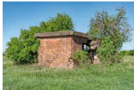
Krakovany - Koralw, zbytky kabelové ústředny

ga, postavená před rokem 1863, která sloužila pro duchovní potřebu židovských rodin z okolních obcí. Zrušena byla již v roce 1906 a od té doby slouží jako skladiště a kůlna. Nesmíme zapomenout ani na katolické křesťany, kteří zde vybudovali dva křížky, každý v jedné části vsi. Ten v dolní části je z roku 1862 a ten v horní části pak z roku 1902. Památník padlým v 1. světové válce je od kameníka Josefa Vinaře z Týnce nad Labem a byl slavnostně od-