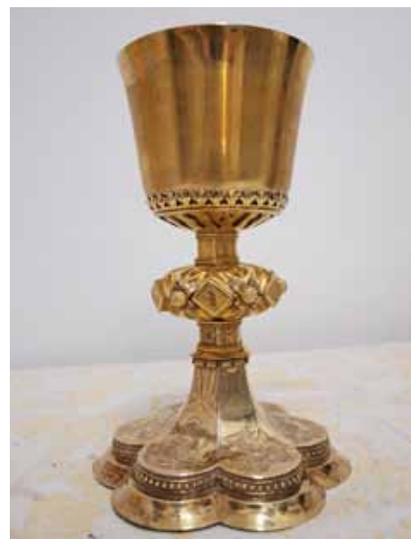
Kalich z Ovčár

Podle jeho slov bude většina svatobartolomějského pokladu vystavena poprvé. Jen několik předmětů bylo možné vidět na výstavách, kdy je muzeum mělo zapůjčené. Mezi nejvzácnější předměty patří pozdně gotický kalich z Ovčár ze začátku 16. století nebo soubor šperlinkovských kalichů z chrámu sv. Bartoloměje, které