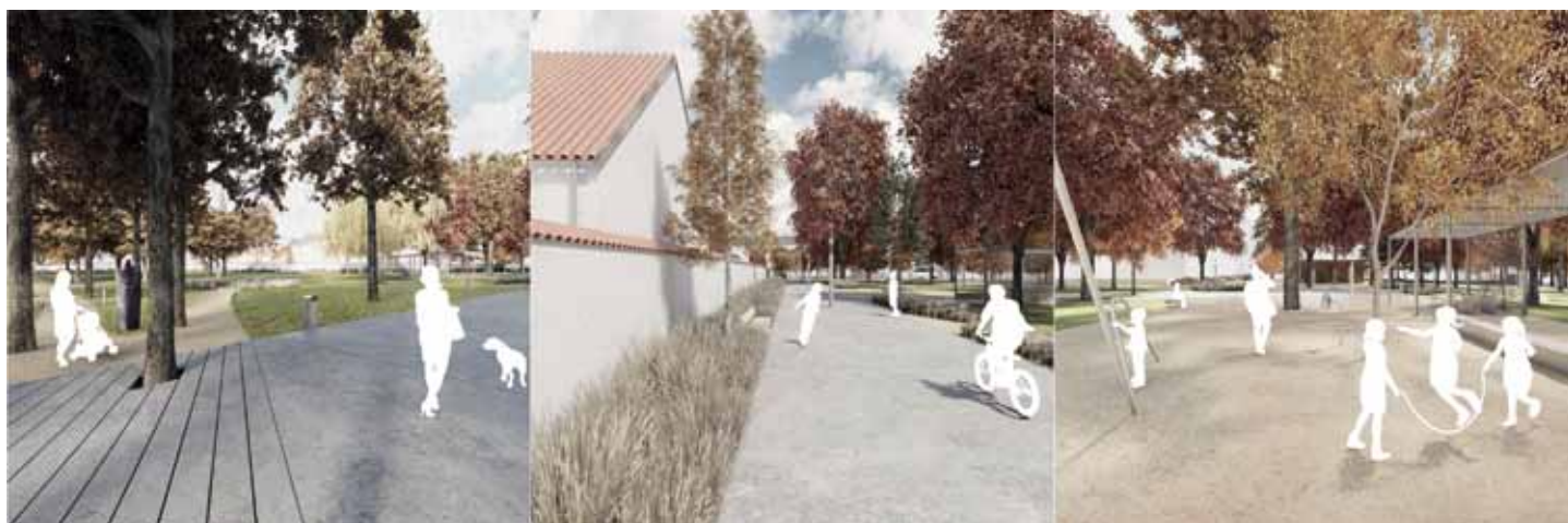
Vizualizace vybraných částí Komenského parku