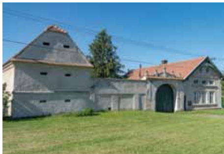
Krakovany - dům čp. 28

verní části obce. Jedná se především o evangelickou modlitebnu, která zde vznikla již v roce 1784, nedlouho po vydání tolerančního patentu Josefa II. (byl vydán 13. října 1781), tedy jako jedna z prvních v Čechách. Sou-