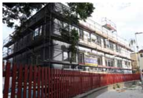
Nový pavilón MŠ Chelčického

V mateřských školách je to na MŠ Bachmačská rekonstrukce dětských toalet a oprava plotu kolem areálu. V MŠ Jeronýmova byly již upraveny parkovací plochy, na MŠ Sendražice probíhá rekonstrukce dětských toalet. V MŠ Bezručova připravujeme zcela nové prostory pro cvičení, setkávání a možnosti besídek. V prostorách bývalého (dnes již nepoužívaného) bytu chystáme velkou rekonstrukci na prostory, které budou sloužit dětem.