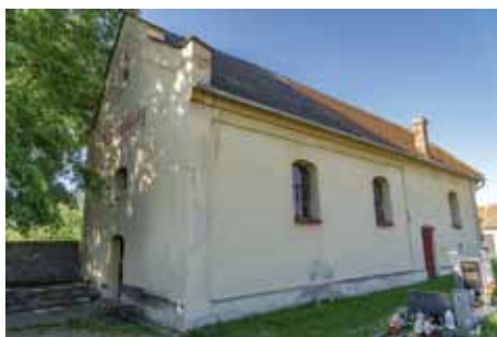
Krakovany - kostel

časná stavba v empírovém stylu s doznívajícími prvky barokního tvarosloví je o něco pozdější. Do užívání byla předána na společné bohoslužbě dne 20. října 1805. Největší rozkvět zaznamenal zdejší evangelický sbor za dlouholetého působení faráře Jana Emanuela Řepy v letech 1885–1931. V roce 1960 byla ubourána polokruhovitá apsida v závěru stavby, čímž stavba získala poněkud