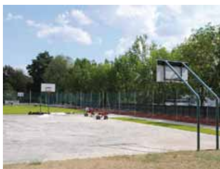
Venkovní hřiště ZŠ Masarykova

V základních školách se též nezahálí. V ZŠ Lipanská probíhá rekonstrukce dívčích toalet a výměna lina ve třídách. V ZŠ Mnichovická se též mění lina a během srpna začne velká rekonstrukce střechy tělocvičny. V ZŠ Ovčárecká se realizuje celková rekonstrukce toalet v celé budově, oprava kanalizačního potrubí a instalace rekuperace, zároveň probíhá úpra-