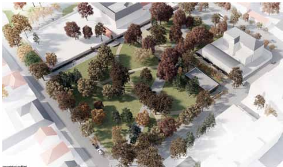
Perspektivní nadhled vítězného návrhu

delšího procesu další analýzy, projektové přípravy a diskusí. Zatím jde o soutěžní návrh, který není projektem, ale spíše konceptem možného řešení.