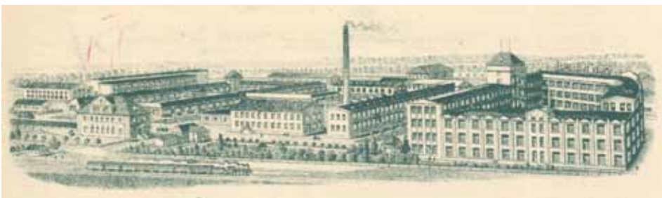
Velim - hlavička firemního dopisního papíru z r. 1936