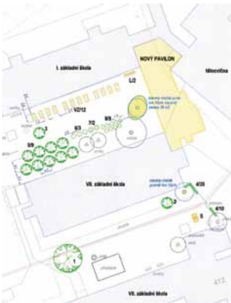
Situční plán nového pavilonu

Projekt je zaměřen na výstavbu nového bezbariérového pavilonu odborných učeben společného pro ZŠ Masarykova a ZŠ Bezručova. Vytvoří se nové odborné učebny s vazbou na klíčové kompetence - přírodní vědy, technické a řemeslné obory. Nové odborné učebny budou vybaveny moderní vyučovací technologií a bude zavedena interaktivní praktická výuka. Díky pořízení moderních vyučovacích technologií bude v učebnách zavedena interaktivní, praktická, názorná a zajímavá výuka. V 1. nadzemním podlaží (NP) společného pavilonu budou vybudovány 2 učebny přírodních věd (každá s jiným zaměřením), kabinet, toalety, bezbariérové WC, šatna a chodba nezbytná pro propojení nově vzniklých prostor. 1. NP bude využívat ZŠ Bezručova. Ve 2. NP dojde k výstavbě 2 odborných učeben (polytechnické učebny a dílny), kabinetu, šatny, toalet, bezbariérového WC, chodby a schodiště propojujícího nově vzniklé prostory. Odborné učebny ve 2. NP budou sloužit ZŠ Masarykova.