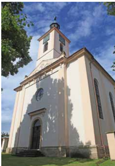
Velim - evangelický kostel

ně románská svatyně z počátku 13. století, přestavěná goticky i barokně, vedle které stojí samostatná barokní zvonice z roku 1771 od kolínského stavitele Františka Tomáše Jedličky. Při silnici na Břežany I stojí velkolepý kos-