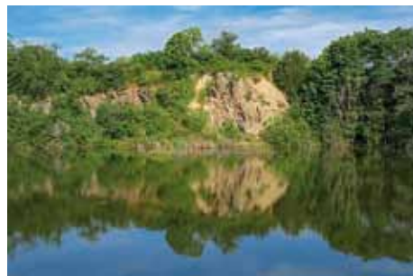
Velim - přírodní památka Skalka u Velimi

nistického. U železničního přejezdu jsou dnes opuštěné budovy továrny na kávové surogáty, čokoládu a slad, kterou založil v roce 1869 Jan Pavel Szalatnay. Od roku 1968 zde byla zahájena výroba známých plátkových peprmintových žvýkaček a bublinkových žvýkaček Pedro, později i plátkových ovocných žvýkaček a tzv. zdravotních žvýkaček s biologickou složkou (lyzátem) značky Sevak. Výroba ve velimské „čokoládovně“ byla ukončena v roce 1994. Z místního nádraží vede krátká odbočka k unikátní železniční stavbě, kterou je zkušební polygon (ovál o délce 13 276 metrů) postavený v letech 1961-63, který dodnes nemá v Evropě obdoby. Na katastru Velimi se nachází i dvě významné přírodní lokality. Tou významnější je národní přírodní památka a evropsky vý-