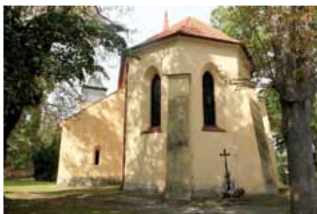
Velim - kostel sv. Vavřince

Velim je unikátní svými archeologickými nálezy, především sídlištěm a sakrálním areálem na Skalce ze střední doby bronzové. Skalka je jedním z nejvýznamnějších hradišť středodunajské mohylové kultury u nás. Na mírném návrší uprostřed obce stojí nestarší dochovaná památka, kostel sv. Vavřince, původně pozd-