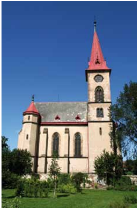
Veletov - kostel