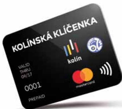
Kolínská klíčenka míří i do dalších základních škol

Pokračujeme i v zavádění moderních technologií do prostředí škol. Kolínská chytrá klí-