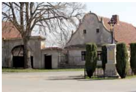
Veletov - usedlost čp 37

téhož roku ale byl 28. května položen základní kámen kostela současného, který podle plánu Jana Krcha postavil kutnohorský stavitel Bohuslav Moravec. Dokončený kostel pak byl slavnostně vysvěcen 11. července 1897. Patronát nad stavbou mělo město Kutná Hora, jehož znak se nachází v tympanonu nad hlavním vchodem. Veletovský kostel je mimochodem nejstarší stavbou od architekta Krcha na Kolínsku. Jednotné je i vnitřní zařízení kostela, které je současně se stavbou a pochází z konce 19. století. Ze stejné doby je i dochovaná kostelní dlažba, pozoruhodná původní výmalba stěn a okenní vitráže, obojí jako důkaz prolínání pozdního romantismu a nastupující secese. Jediné, co se dochovalo z původní stavby, je zvon z roku 1619 s průměrem 110 cm, výškou 83 cm a váhou 2 000 kg). Kostel Zvěstování