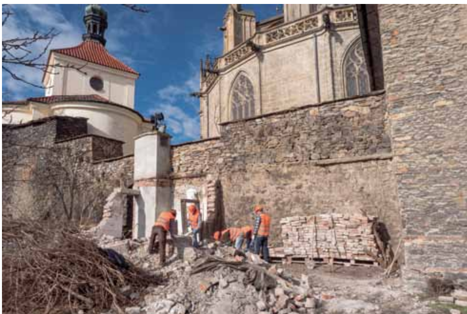
V areálu chrámu sv. Bartoloměje byly zahájeny přípravné práce k následné revitalizaci zelených parkánů. Dochází k odstraňování náletových dřevin a bourání poškozených objektů.

Pro aktuální informace sledujte www.mukolin.cz