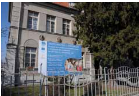
Základní škola v Sendražicích dostane nová okna

V poslední době proběhly četné rekonstrukce. Například obnova fasády a nasvícení ZŠ Kmochova, rekonstrukce systému vytápění tamtéž, v letošním roce bude dokončena oprava tělocvičny a kompletní změnou projde celý dvůr i oplocení směrem od Jaselské ulice. Na ZŠ Bezručova jsme dokončili úpravy vnějších prostor a chodníků a opravili tělocvičnu, pracujeme na projektu obnovy celé jídelny a kuchyně. Na ZŠ Lipanská jsme vybudovali nový vstupní prostor do celého areálu, zastřešili vchod a postupně rekonstruujeme WC. ZŠ Mnichovická získala nové venkovní hřiště, v letošním roce dojde k rozsáhlé opravě střechy tělocvičny. ZŠ Ovčárecká spustila rekonstruovaný objekt Techcentra pro technické vzdělávání a každoročně jej doplňuje dalšími zajímavými možnostmi