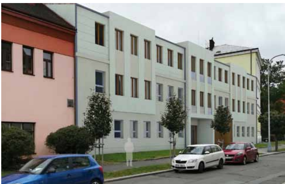
Vizualizace přístavby ZŠ Mnichovická