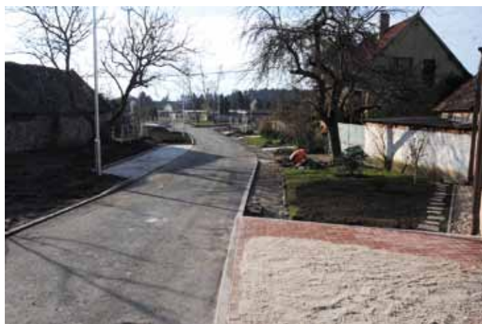
V polovině prosince byla dokončena oprava ulice V Zahradách v Sendražicích mezi křižovatkou s ulicí Příční a křižovatkou s ulicí Hlavní. Součástí akce byla rekonstrukce komunikace v délce 160 metrů, veřejného osvětlení a sadové úpravy. Komunikace byla navržena jako obousměrná jednopruhová o šířce jízdního pruhu 3,5 m. Vyhnutí protijedoucích vozidel je umožněno v místech vjezdů. Stávající povrch vozovky byl opatřen asfaltovým krytem. V ulici také proběhla rekonstrukce vodovodního řádu, jejímž investorem bylo Vodohospodářského sdružení Kolín.