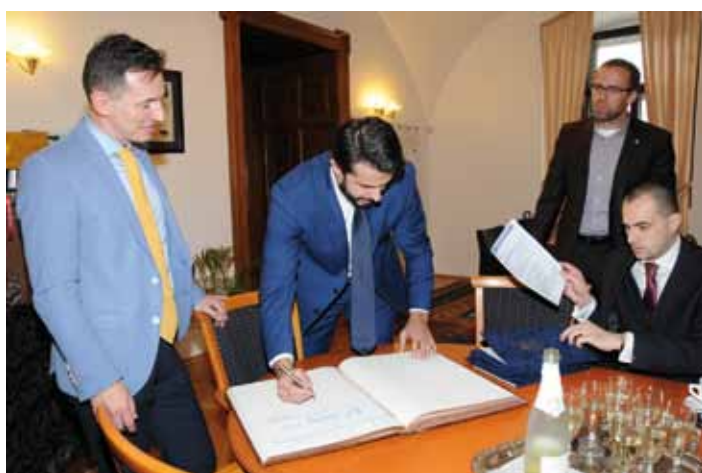
V polovině listopadu podepsalo město Kolín smlouvu o prodeji pozemku o velikosti 35 101 m 2 v průmyslové zóně Kolín-Ovčáry. Kupující společnost RP Ovčáry zde do konce příštího roku otevře centrum s několika obchody včetně supermarketu.