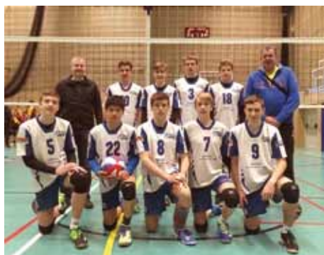
Starší žáci skončili na republikovém šampionátu šestí

Že se SK Volejbal Kolín práce s mladými hráči daří, ukazuje i program pro příští sezó-