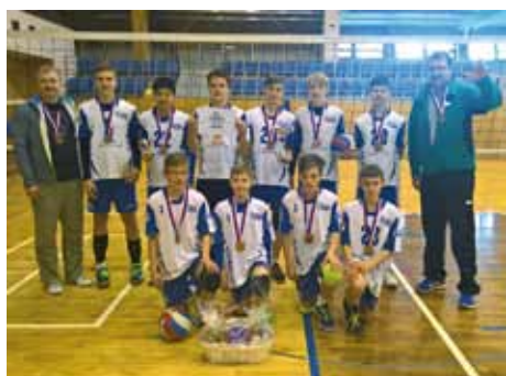
Tým mladších žáků SK Volejbal Kolín, který vybojoval 3. místo na mistrovství republiky

Začneme od nejblyžtivějšího medailového úspěchu. Tým mladších žáků vybojoval v dubnu na mistrovství republiky bronz, a to v konkurenci desítek klubů z celého Česka. Nechal za sebou přitom i týmy z tradičních volejbalových měst a nechybělo mnoho, aby SK Volejbal Kolín hrál ve finálovém turnaji dokonce o zlato. I tak se jedná o nejlepší umístění kolínského mládežnického týmu v historii. Navíc toto nadějně družstvo suve-