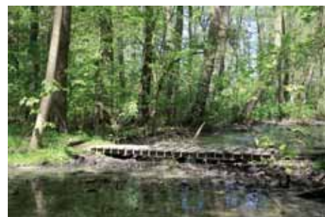
Pňov - Pňovský luh

věstmi opředený tak zvaný Oldříšský dub. Jedná se o dub letní ( Quercus robur ) zasazený kolem roku 1480, který byl v srpnu 2000 bohužel vyvrácen vichřicí. Jeho ležící torzo, dlouhé 25 m, je od roku 2007 zakryto stříškou a v sousedství roste jeho potomek, starý cca 170 let. Jedinou památkou v Klipci je na návsi stojící dřevěná zvonice z roku 1877, postavená u příležitosti 100. výročí založení obce.