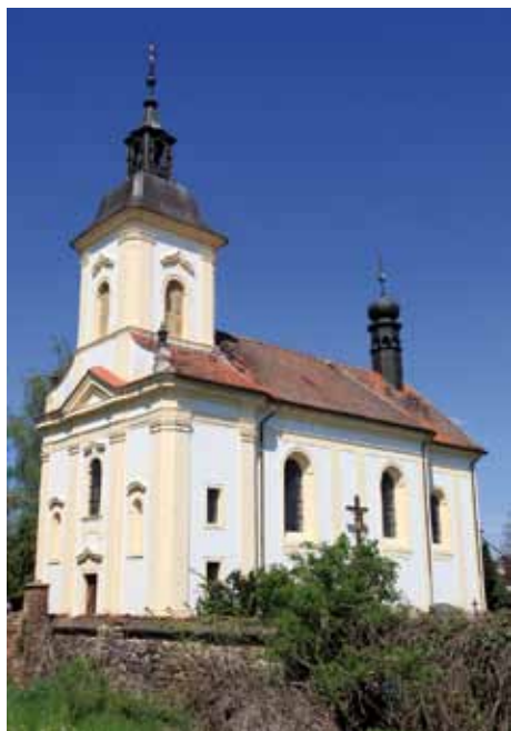
Předhradí - kostel

Pňov-Předhradí leží 8 kilometrů severně od Kolína v nadmořské výšce 190 metrů.