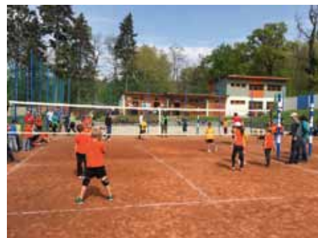
Krajské finále minivolejbalu v Kolíně

Nakonec ještě o těch nejmenších, kteří jsou naší nejpochetnější skupinou. SK Volejbal Kolín má 90 dětí, které nastupují v soutěžích