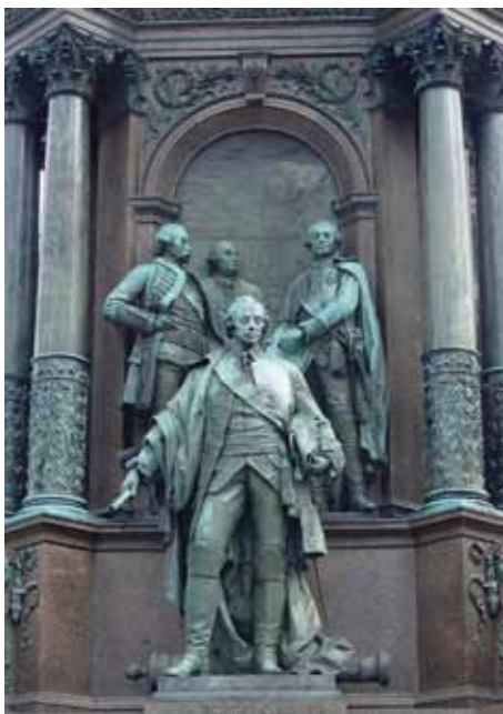
„Otec rakouského dělostřelectva“ polní maršál Josef Václav kníže z Liechtensteinu na památníku Marie Terezie ve Vídni, vpravo velitel „holobrádků“ v bitvě u Kolína generál jízdy hrabě Franz L. Nádasdy

Zásadní změny provedl i u náboru a školení dělostřelců. Dosud byli spíše cechem nebo bratrstvem, od roku 1753 to byl druh stálé armády s o třetinu vyšším platem, než měli pěšáci, ale delší službou. Dělostřelcem se mohl stát pouze svobodný muž, který uměl číst a psát německy. Do důstojnických hodností byli na-