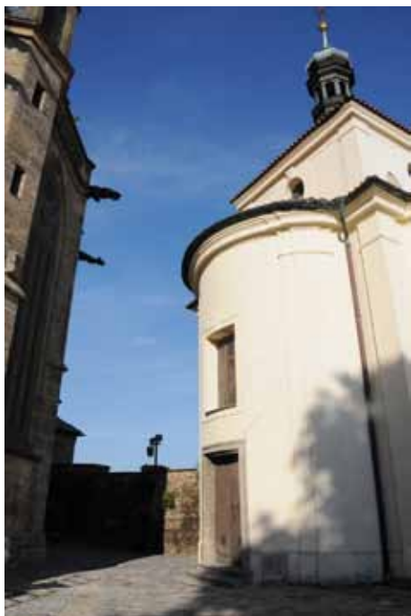
Opravy se dočká i barokní kostnice

Žádali jsme o dotaci přes 89 mil. Kč a byla nám přiznána. Na přípravě jsme pečlivě pracovali více než rok a půl a věříte, že to opravdu nebylo jednoduché. V Kolíně vznikne zcela ojedinělý, krásný nový prostor. Je to obrovský úspěch pro Kolín a jeho budoucí rozvoj i na poli cestovního ruchu a já chci poděkovat všem, kteří se na jeho realizaci s námi podíleli.