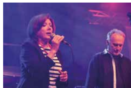
Marie Rottrová na 53. ročníku Kmochova Kolína

Kmochův Kolín 2015 - Čechomor a Marie Rottrová – festival se podařilo zatraktivnit pro široké spektrum diváků. Na třídní festival se