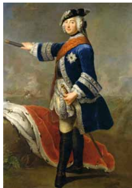
Pruský král Friedrich II.

Mezi vzácnými hosty bude i hlava Lichtenštejnského knížectví princ Alois s manželkou Sofií. Jeho prastrýc kníže Josef Václav totiž provedl v letech 1744-1757 zásadní refor-