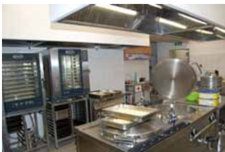
Kuchyně ZŠ Masarykova

ZŠ Kmochova fasáda- 1. etapa ZŠ Mnichovická fasáda přístavby ZŠ Ovčárecká rekonstrukce osvětlení, přístavba technické dílny