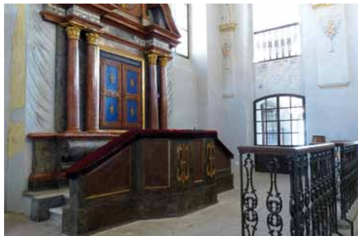
V prosinci byly dokončeny restaurátorské práce na schránce na toru Aron ha-kodeš v kolínské synagoze. Provedené restaurátorské práce byly provedeny tak, aby byly zachovány hmotné podstaty historického artefaktu pro další generace.