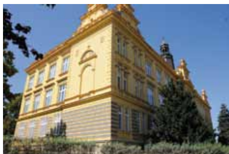
Nová fasáda ZŠ Kmochova

MŠ Bachmačská rekonstrukce střechy se zateplením MŠ Bezručova chodníky v areálu školky MŠ Kmochova rekonstrukce plotu MŠ Masarykova kompletní rekonstrukce kuchyně MŠ MŠ Sendražice kompletní rekonstrukce kuchyně MŠ ZŠ Lipanská zastřešení vchodu do školy ZŠ Bezručova rekonstrukce venkovních ploch - dokončení