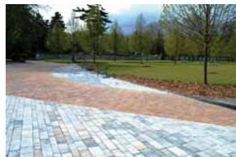
Centrální hřbitov Kolíně

Městský centrální hřbitov a městské hřbitovy – pokračujeme v investicích na pietních místech města se záměrem zvýšení jejich společenské hodnoty, provádíme sadovnické úpravy, výsadbu dřevin, zakládání nových