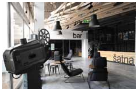
Nové foyer kolínského kina 99

Kino 99 - kompletní nové foyer kina a zároveň vybudování kinoklubu/kavárny, které budou přístupné i z prostor polikliniky. V současné době probíhá výběrové řízení na provozovatele. V kině vzniklo nové zázemí, šatna a byla instalována vzduchotechnika..