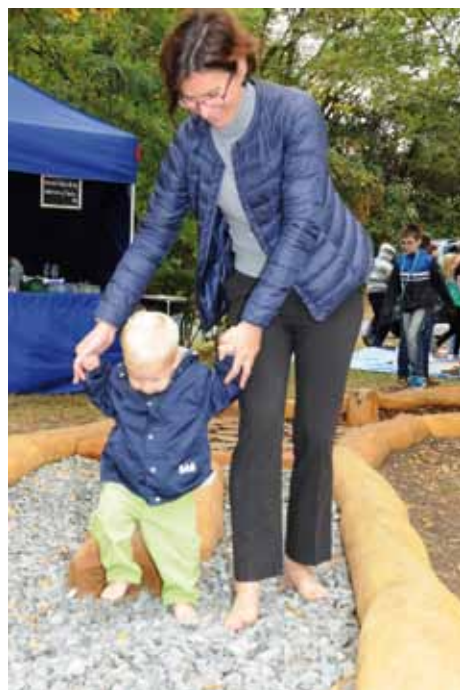
Bosá stezka v Borkách

Bosá stezka - na zálabské straně (u workoutového hřiště) vznikla bosá stezka. Jedná se o další z podnětů od občanů Kolína, který byl realizován. Součástí jsou i lavičky k posezení a informační tabule o bosé chůzi.