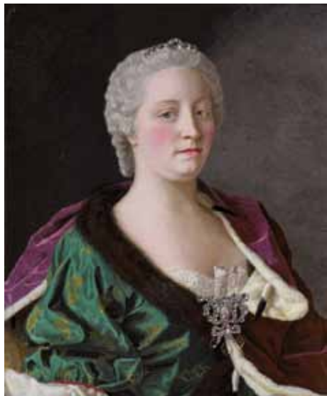
Portrét císařovny a královny Marie Terezie z doby, kdy k bitvě došlo

V červnu 2017 si Česká republika připomene jednu z nejvýznamnějších bitev ve svých dějinách - bitvu u Kolína. Tehdy totiž šlo o zachování českého státu a národa.