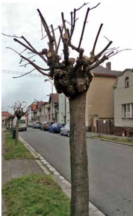
Popouštěcí řez u javorů v ulici Písečná

Poslední skupina řezů je specifická svým pravidelným opakováním po celý život dřeviny. Cílem je udržení korun stromů v požadovaném tvaru. Asi neznámější je řez na hlavu. Provádí se pouze na stromech s dobrou korunovou a kmenovou výmladností, jako jsou lípy, platany, jírovce, jasany či hlohy. Řez na hlavu se provádí zpravidla v intervalu 1-3 roky, přičemž výhony jsou sesazovány na zapěstované zduřeny, zvané hlavy. Nejlepší období pro realizaci tohoto řezu je těsně před rašením listů. Podobným řezem je řez popouštěcí. Jedná se o opakovaný tvarovací řez výhonů s možností postupného zvyšování místa tvarování. Výhony se seřezávají na čípky technikou řezu naslepo. Ostatní výhony jsou odstraňovány úplně. Posledním speciálním řezem je řez živých plotů a stěn. Tento zásah lze realizovat pouze u druhů dřevin s dobrou korunovou výmladností a snázejících tvarování. Řez se provádí obvykle 1-2x ročně. Výška a tvar živého plotu či stěny se řídí zejména péstebním záměrem, ale také stanovištními podmínkami a vlastnostmi použitého taxonu dřevin. Výrazně sesazení, tedy řez do starého dřeva, je možné pouze výjimečně a u dřevin s velmi dobrou kmenovou a korunovou výmladností, jako je tis červený nebo habr obecný.