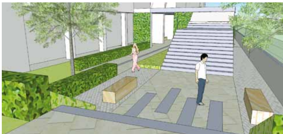
Vizualizace městských teras

Prostor by měl začít sloužit od léta příštího roku.