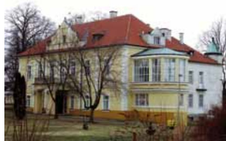
Starý zámek v Ratboři na Kolínsku patřil Thurn-Taxisům jen krátce

ktej ke zklamání rodičů netoužil po nejvyšších funkcích a hodnostech. Byl mecenášem a podporoval řadu českých a moravských vlasteneckých spolků. V roce 1861 se stal zakladatelem a prvním předsedou pěveckého spolku Hlahol a Moravan. Stál také při vzniku Tělocvičné jednoty pražské (pozdější Sokol) a Umělecké besedy. Usiloval o zrovnoprávnění Čechů s dalšími národy monarchie, o uznání češtiny jako úředního jazyka.