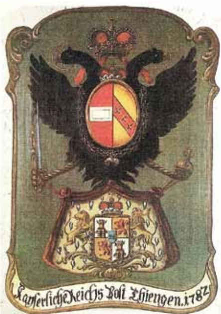
Vývěsní štít říšského císařského poštovního úřadu Thurn-Taxisů s jejich erbem z roku 1782.

Na počátku byl lombardský rod Tasso žijící nedaleko Bergama na severu dnešní Itálie, o kterém máme zprávy z konce 12. století. Okolo roku 1290 Omodeo de Tasso zorganizoval se svými 32 příbuznými kurýrní službu mezi Milánem, Benátkami a Římem. V roce 1450