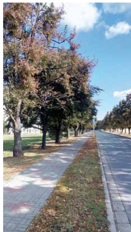
Stav stromů po ošetření

Kdykoliv během roku je možné provádět odstranění kořenových a pařezových výmladků ze spodní části kmene a okolí stromu. Interval opakování se řídí dynamikou vývoje výmladků a provádí se technikou odstraňování výmladků. Řez tedy má být vedený paralelně s mateřskou větví či kmenem tak hluboko, aby výmla-