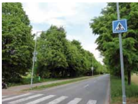
Stav stromů před ošetřením

Jedním z nejčastěji prováděných zásahů na dřevinách je realizace řezu bezpečnostního. Jeho cílem je pouze zajištění aktuální provozní bezpečnosti stromu. Při bezpečnostním řezu jsou odstraňovány, případně redukovány tlusté suché větve, které aktuálně narušují provozní bezpečnost stromu, větve zlomené či nalomené, mechanicky poškozené nebo se sníženou vitalitou. Dále se řeší defektní větvení a odstranění či redukce přerostlých sekundárních větví, které pochází ze spících nebo