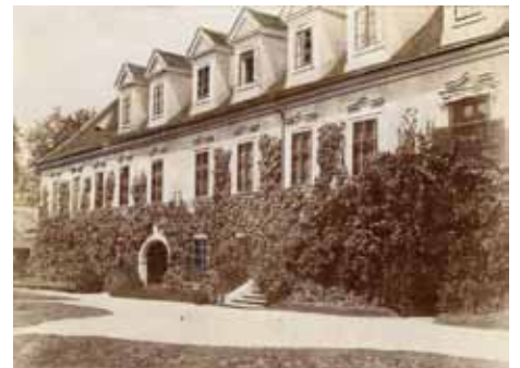
Původní krása zámku a zámeckého parku v Červených Pečkách u Kolína na historické fotografii.