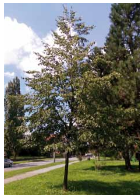
Lípa po výchovném řezu

grafii stromu v bezlistém stavu a olistěného, ale určitě je možné na druhé fotografii využít, že v rámci výchovného řezu došlo k odstraně-