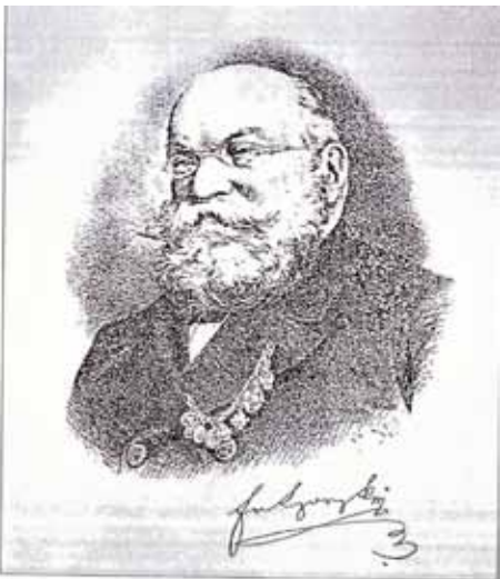
Obr. 3: Portrét Františka Horského z: L. Skala, František Horský v české zemědělství.

Byl velmi úspěšný manažer, zaváděl zde nové metody, které zlepšovaly kvalitu orné půdy (vydatné hnojení půdy, zakládání kompostů, střídavý osevní postup), zaváděl nové účinnější zemědělské stroje apod. Přitom zdokonalil ruchadlo a za svůj život vynalezl nebo zdokonalil 62 zemědělských strojů. Pro využití produktů zemědělství podporoval vznik