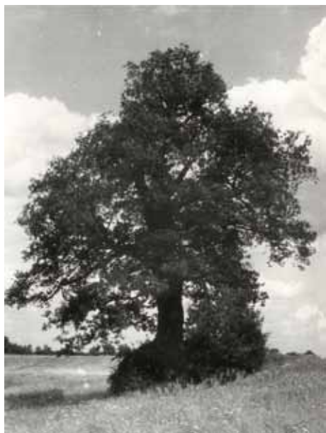
Dub - Veltruby. 12. 8. 1954

V prvním článku jste byli stručně informováni o stávající právní legislativě. Dnes platný zákon o ochraně přírody a krajiny samozřejmě navazuje na dřívější zákony a vyhlášky, a to i týkající se ochrany význačných stromů. V archivu přírodovědného oddělení Regionálního muzea v Kolíně se nacházejí historické písemné dokumenty („protokoly“) z let 1941-1942 a 1953-1955 nazývané „Soupisy památných neb význačných stromů, stromořadí a porostů...“ K nim se však nevztahuje žádná právní úprava. Na území Kolínska je prvním oficiálním seznamem „Soupis památných stromů, stromových skupin a stromořadí“, schválený rozhodnutím Rady ONV Kolín č. 240 ze dne 9. července 1981. Tyto stromy byly posléze usnesením Rady SKNV č. 24 z 25. ledna 1983 prohlášený dle § 6 odst. 1 zák. č. 40/1956 Sb. za chráněné přírodní výtvo-ry (CHPV). Jednalo se o 41 položek obsahujících celkem 200 stromů. K dalšímu doplnění došlo vyhláškou ONV