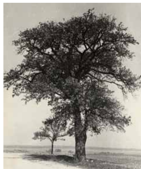
Hrušeň - Jestřabí Lhota. 26. 5. 1954

Na likvidaci jediné chráněné hrušně obecné ( Pirus communis L.) se bohužel podílel člověk. Strom rovněž vyhlášený za chráněný v letech 1981-1983 (evidenční číslo 204029.1/1) rostl na parcele číslo 677/2, v katastrálním území Jestřabí Lhota, při pravém okraji silnice vedoucí do Volárny. Někdy v roce 1986 nebo 1987 byla vznikající