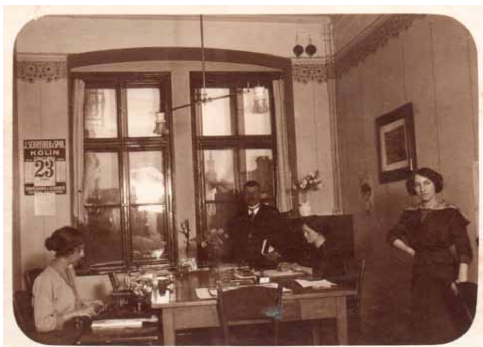
Na kalendáři je rok 1914. Co to může být za kancelář?

Nabízíme vám třetí snímek ze série historických fotografií ze sbírky pana Karla Holovského z Kolína. Všechny zachycují nepopsané, nedatované či jinak neobjasněné a nám dosud neznámé výjevy z života v Kolíně v první polovině 20. století. Široká veřejnost se tak může zapojit a pomoci tyto snímky objasnit a zařadit - ať už na základě svých znalostí či vědomostí nebo třeba díky vlastní soukromé sbírce. V rámci této historické poznávací soutěže - soutěže tak bude každý měsíc zveřejněna jedna z těchto fotografií, jejíž popis či své poznatky k ní můžete zasílat na adresu redakce. Nejprínosnější z badatelů bude po zásluze odměněn v lednu roku 2017.