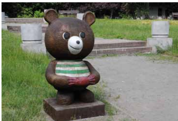
Dřevěné sochy populárních medvědů, kteří se potkali u Kolína, stojí od středy 8. června v parku u kolínských Borků. Medvědy vytvořil řezbář pan Jára původně k jarní výstavě o životním prostředí. Dřevěné sochy byly poté uloženy u AVE a po vytvoření podstavců byli medvědi usazeni na místo.