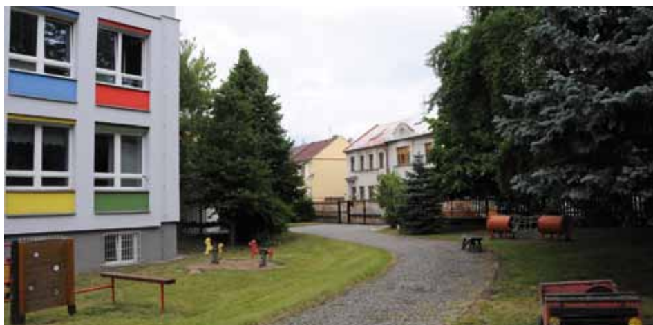
V areálu mateřské školy Chelčického vznikne v případě přiznání dotace nový pavilon.

Základní školy rozhodně nezůstanou stranou a opět se bude výrazně investovat. Největší a nejviditelnější rekonstrukcí v současné době již prochází ZŠ Kmochova. „Západka“ dostává nový kabát a pracujeme i na následném nasvícení této krásné budovy, čímž nočnímu Kolínu vznikne další přitažlivá dominanta. Zateplení přístavby a nová fasáda budou zhotoveny i na ZŠ Mnichovická. Areál ZŠ Bezru-