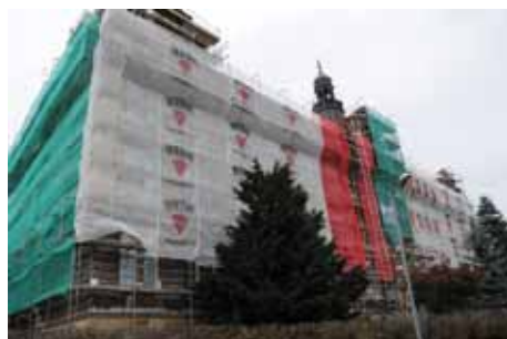
„Západka“ dostává novou fasádu.

V MŠ Bezručova proběhne výměna venkovních chodníků mezi pavilony v celém areálu. MŠ Bachmačská dostane zateplení střechy, která bude též opravena. Zkrátka nepříjde ani MŠ Kmochova, kde je již dokončena oprava oplocení kolem celé školky, v MŠ Jeronýmova