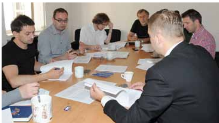
7. června se poprvé sešla porota architektonicko-urbanistické soutěže o návrh „Revitalizace Pražské ulice v Kolíně.“ Architektonická soutěž má řešit úsek ulice Pražská od světelné křižovatky Modrý bod až na náměstí Republiky a je první fází v sérii připravovaných rekonstrukcí širšího centra města Kolína.