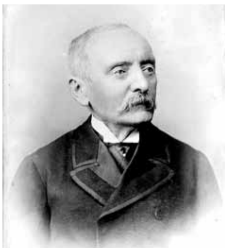
Kníže Philipp Ernst von Hohenlohe-Schillingfürst byl významným mecenášem, předsedou Německého olympijského výboru a zakladatelem lázní v Poděbradech

Chlodvíkův provorozený syn Philip Ernst Maria kníže Hohenlohe-Schillingfürst (1853-1915) byl mecenášem, podporo-