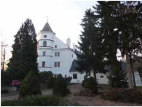
Zámek v Radimi u Kolína je spojen s životem významného vojenského pedagoga Františka Josefa hraběte Kinského

Ať již se jedná o kolínský hrad, Radim nebo nedaleký Chlumeck nad Cidlinou. V 18. století se rod rozdělil na hraběcí a knížecí větve.