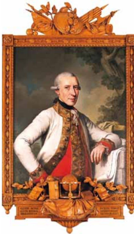
Generál a významný vojenský pedagog František Josef Kinský

Prvorozený syn František Oldřich I. (1634-1699) byl významným diplomatem. V roce 1679 zastupoval císaře na jednání o míru s Francií v Nimwegenu. Zato získal řád Zlatého rouna a úřad nejvyššího kancléře Království českého. Hrabě miloval český jazyk,