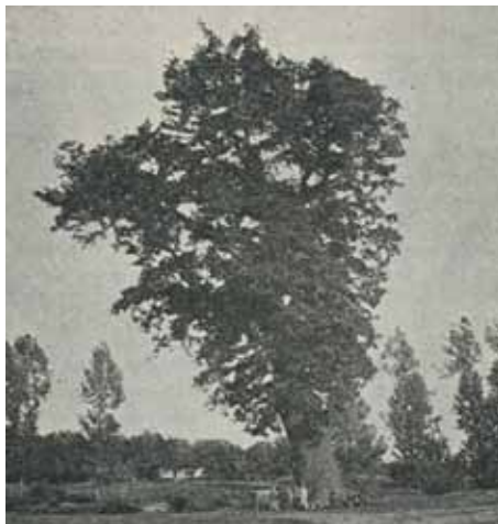
Výřez fotografie F. Opplta. Snímek vyšel v knize Karel Kožíšek a kol., Poděbradsko, Obraz minulosti i přítomnosti , 1906

jitele tvrze. Její otec přichystal vdavky své jediné dcery s urozeným, bohatým, ale mnohem starším a osklivým pánem. Věno nastávajícího ženicha mělo zbavit chátrající tvrz dluhů, které zeman, otec dívky, nadělal. Dceři se do svatby vůbec nechtělo a každého večera nařiči-