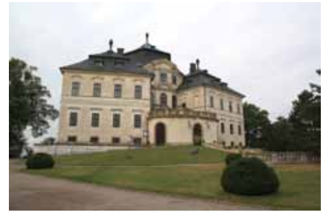
Barokní zámek Kinských v Chlumci nad Cidlinou je vrcholným dílem Giovanniho Santiniho-Aichla