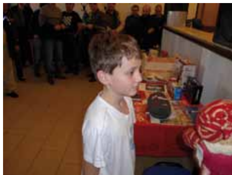
Nejmladší účastník turnaje při předávání cen

Po vyrovnaných bojích během celého dne se rozhodovalo o vítězi až v posledním kole. Ví-