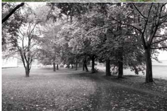
Vizualizace projektu Regenerace panelového sídliště Kolín, ulice Benešova. Obrázky dole - stávající stav.