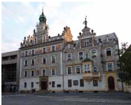
Jakub Krčín z Jelčan se s největší pravděpodobností narodil v Zámecké ulici č. p. 79, v domě vedle dnešní radnice (na jeho místě stojí Městský společenský dům).

Jakub studoval na latinské škole při farním chrámu sv. Bartoloměje v Kolíně. Protože majetek rodiny nestačil na obživu, musel v roce