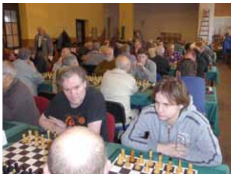
Vítěz turnaje na snímku vlevo

45. ročník vánočního bleskového turnaje jednotlivců se uskutečnil v sobotu 19. 12. 2015 tradičně ve velkém sále hostince „U Černohlávků“ v Sendražicích. Hladký průběh celého turnaje zajistil organizačně místní šachový oddíl. Turnaje se zúčastnilo celkem 54 hráčů. V příjemném prostředí se ke spokojenosti