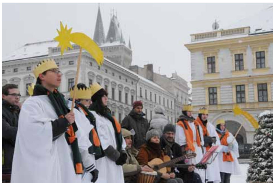
Ve středu 6. ledna se na Karlově náměstí sešli koledníci Farní charity Kolín, aby za hudebního doprovodu Dvouleté katolické střední a mateřské školy připomněli tradici Tří králů.

Výtěžek sbírky je určen na podporu další činnosti Farní charity na Kolínsku v oblasti služeb a podpory aktivního života pro místní znevýhodněné občany, pro seniory, rodiny s dětmi i sociálně slabé či zdravotně handicapované. V letošním roce bychom se chtěli zaměřit na dobrovolnické aktivity pro rodiny s dětmi ze sociálně slabých rodin. V průběhu roku vás budeme prostřednictvím kolínských médií a našich webových stránek www.kolin.charita.cz informovat o konkrétních akcích.