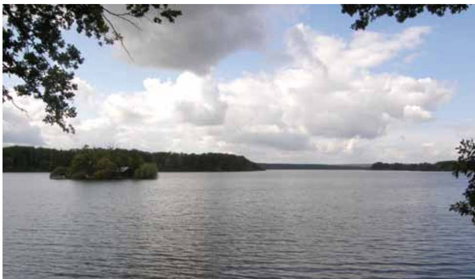
Rybník Svět – původním názvem Nevděk v letech 1571–73 vybudoval Jakub Krčín z Jelčan. Po velké povodni v roce 1611 byl rozdělen na rybníky Opatovický a Svět.