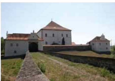
Renesanční tvrz v Křepenicích si postavil Jakub Krčín a pojmenoval ji Hrádek nový Krčínov.

Pro lepší správu rožmberských financí založil v roce 1578 účtárnu. Jakub Krčín nešetřil pracovními silami a neváhal jednorázově na-