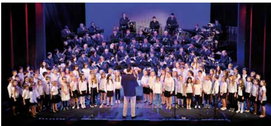
Hudebníci Městské hudby F. Kmocha, zpěváci 4. ZŠ Kolín a Boni Bambini opakovaně společně koncertovali v pátek 11. 12. v kolínském divadle pro 850 diváků.

Jejím výsledkem je 1773 kg potravin, které jsou určeny potřebným