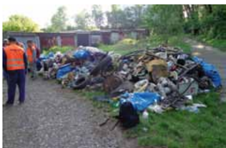
Úklidové čety se v květnu pohybovaly u garáží za Lučebnými závody. Během prvních týdnů jejich činnosti bylo v rámci likvidace černých skládek odvezeno 15 ks kontejnerů a poté odevzdáno téměř 30 tun odpadu!