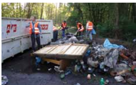
Úklid v prostoru Veltrubské ulice (pravá strana). Pracovníci veřejně prospěšných prací likvidovali černé skládky také na odpočívadle u Třídovské, v Borkách, u Tesca a na dalších místech.