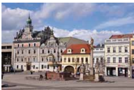
Centrum města začalo v důsledku průmyslového rozvoje předměstských částí přicházet o svůj dosavadní obchodní ruch.

Potlačení života politického ale posílilo paradoxně život kulturní a věčná touha lidí po jisté angažovanosti byla naplňována jinde, a tak vyšel např. v roce 1853 znovu Máchův Máj, v roce 1855 Babička B. Němcové a v roce 1858 almanach Máj). Bachova politika prospívala českému hospodářství. Stavěly se nové továrny a železniční tratě, rozvíjela se těžba uhlí.