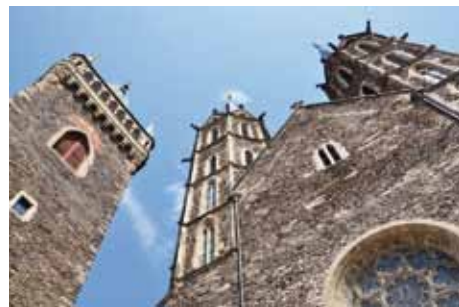
V roce 1857 byla dokončena rozsáhlá rekonstrukce chrámu sv. Bartoloměje, která trvala celých deset let.

Naproti tomu se velice rychle začal (i díky železnici) rozvíjet v Kolíně průmysl. Za klášte-