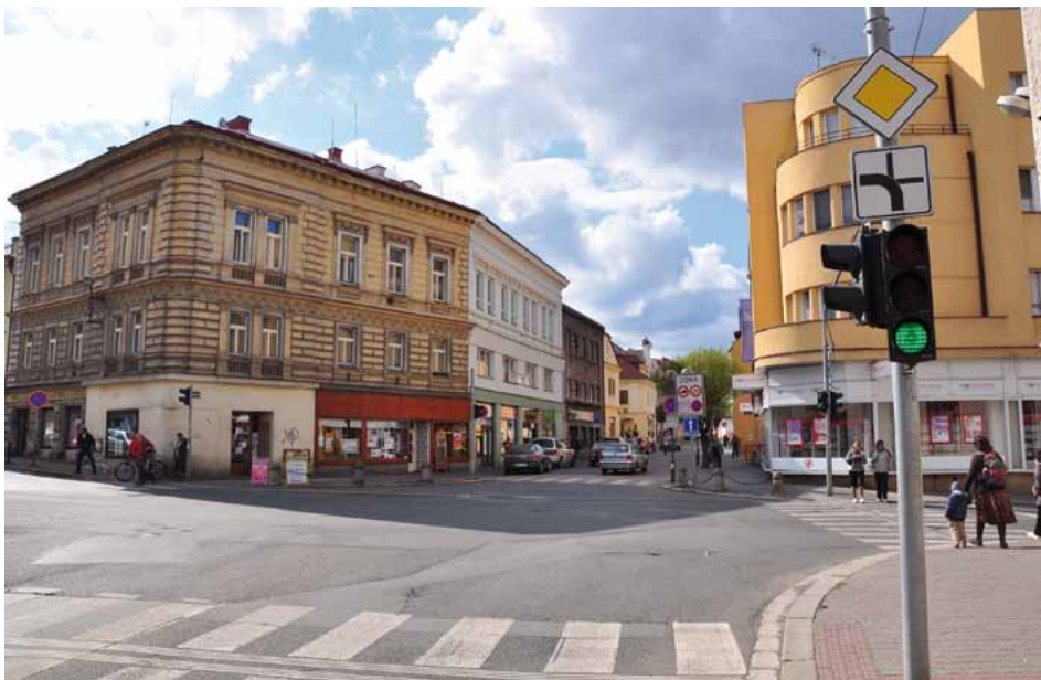
V těchto místech končil středověký Kolín branou Horskou. Směrem k nově vzniklému nádraží ležely do té doby jen předměstské dvory, ale expanze výstavby obytných domů na sebe od poloviny 19. století nenechala dlouho čekat. Spojnice železničního uzlu a centra města se velice brzy ukázala jako místo číhajícího ruchu.