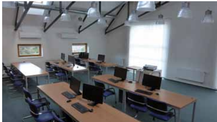
Školicí místnost ve 3. nadzemním patře disponuje až 24 místy.