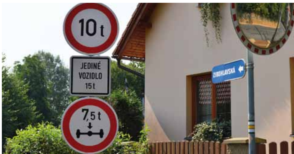
Na žádost zibohlavských občanů byla na křižovatku v Radovesnicích II umístěna omezující dopravní značka. Více informací v dopravním sloupku vlevo.