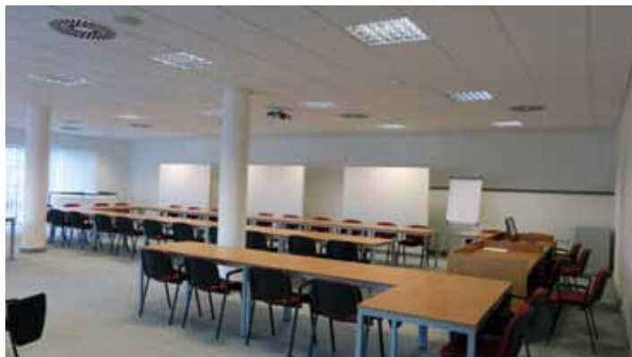
Sál v přízemí je vhodný pro akce většího charakteru.