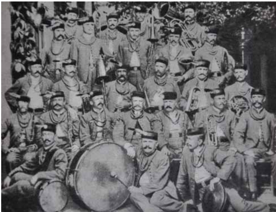
Kmochova dechová kapela v době zájezdu na Jungmannovy oslavy v Praze v roce 1873

Hrálo se na Žofíně, v Riegrových sadech, na Letné, na Střeleckém ostrově, v Měšťanské besedě, ale i v různých zahradách a samozřejmě hostincích.... Prý stačilo, když se na ručně psaný plakát dalo „Kmoch v Praze“ a k tomu den, místo a hodina a obecenstvo plnilo vyhrazené prostory do posledního místa... Kmoch hrával v Praze i při velkých celonárodních slavnostech, jako byla Průmyslová výstava v roce 1891 či Národopisná výstava v roce 1895.