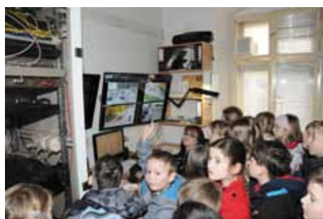
9. dubna si služebnu Městské policie Kolín včetně kamerového systému prohlédly děti ze 2. třídy 6. ZŠ

spoluobčany. Chystáme společně jednu velkou novinku, na této akci se naši nejstarší spoluobčané setkají se zajímavými hosty. Bude ovšem třeba se přihlásit, protože máme jen omezený