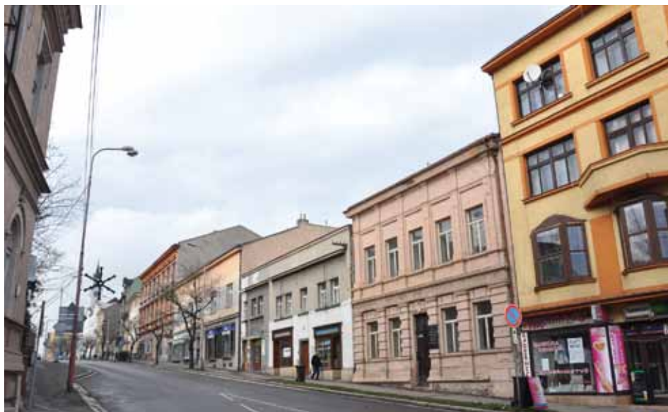
Kmochův dům v Kutnohorské ulici stával kdysi v zástavbě řady měšťanských domů nedaleko budoucího městského divadla.