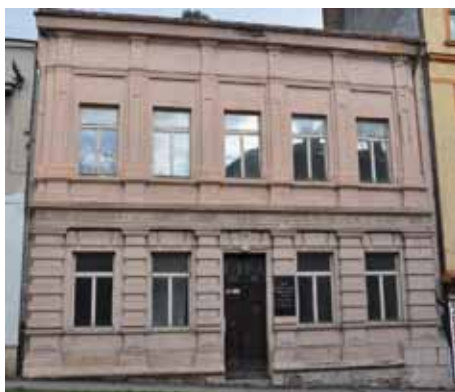
Dům č.p. 50 známý v Kolíně jako Kmochův dům, kde slavný kapelník žil se svou rodinou až do své smrti.

Mladí manželé bydleli nejprve v Husově ulici (čp. 102) a v roce 1883 si z Josefínina věna za-