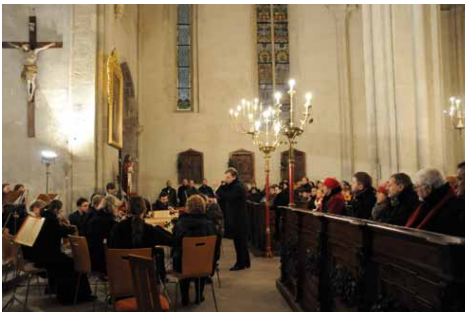
Středeční podvečer 10. prosince patřil v zaplněném chrámu sv. Bartoloměje České mši vánoční J. J. Ryby v provedení Kolínské filharmonie a kolínských pěveckých sborů.

Zápis do všech kolínských škol proběhne ve dnech: čtvrtek 15. ledna 2015 a pátek 16. ledna 2015.