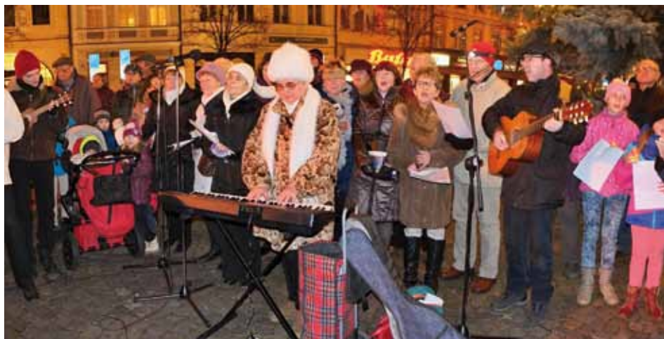
Kolín se 10. prosince připojil k projektu Česko zpívá koledy, a tak se na Karlově náměstí pod vánočním stromem sešlo několik stovek zpěváků, kteří si společně zazpívali šest nejznámějších českých koled.

V rámci projektu Stromy pod kontrolou byly v Kolíně ošetřeny stovky stromů