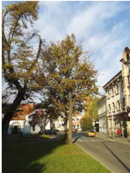
Parčík před okresním soudem

inventarizace dřevin prezentované na portálu www.stromypodkontrolou.cz . V průběhu