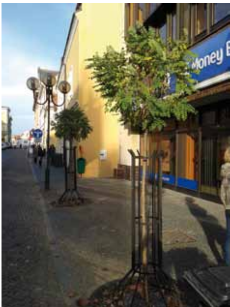
Nová výsadba v Kutnohorské ulici

Rádi bychom uvedli, že jiné východisko než jednorázová obměna uličních stromořadí nebylo možné. Hlavním důvodem byl nejen požadavek Národního památkového ústavu, ale i čistě zahradněarchitektonické hledisko, neboť případné pouhé doplňování podobného stromořadí by nepůsobilo dobře. Jistě si každý vzpomene, že v Kouřimské ulici byla velmi omezena funkce lamp veřejného osvětlení, když byly původní stromy v plné síle. S výměnou druhu, který má spíše sloupovitý tvar koruny a snáší pravidelný i hluboký řez, lze očekávat změnu k lepšímu. Aby nám stromy v uvedených ulicích vydržely alespoň 20 let jako jejich předchůdci, žádáme všechny občany, aby se k nim chovali šetrně, a cyklisty upozorňujeme, aby si stromy nepletli s jinými zařízeními veřejného prostoru a neopírali o ně svá jízdni kola. V centru města probě-