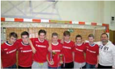
Vítězové starší kategorie chlapců - ZŠ Mnichovická

Jak se již stalo v posledních letech sportovní tradicí, je podzim na základních školách vnímán jako období florbalových turnajů. Stejně tomu bylo i letos. Turnaje se konaly ve čtyřech kategoriích, dvou chlapeckých a dvou dívčích. Hlavním organizátorem a garantem celé soutěže byla opět ZŠ Mnichovická Kolín. Peda-