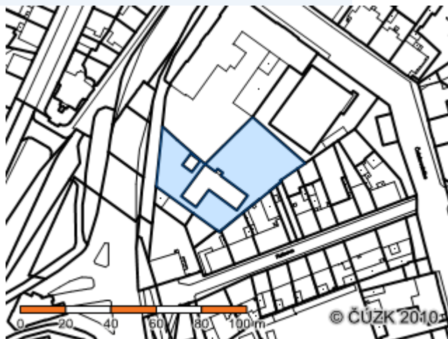
Zobrazení v grafickém prohlížeči

Druh pozemku: zastavěná plocha a nádvoří